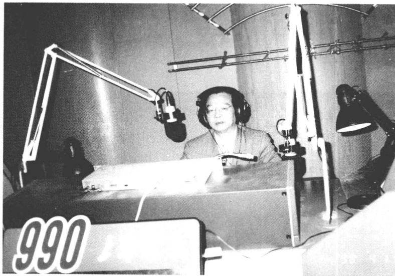
作者应邀先后主持了上广电台、财经频道等节目