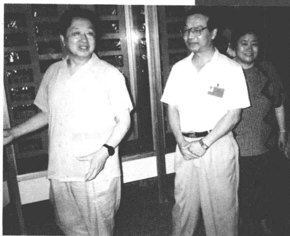
中央纪委副书记、监察部部长曹庆泽来钱币馆参观。