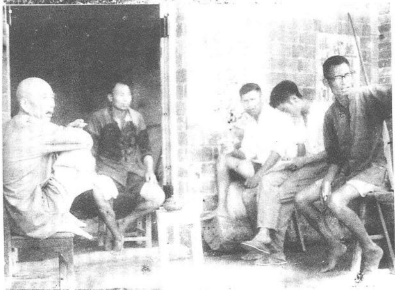
王震同志在红星垦殖场成立三结合科研小组，并亲任组长。 这是王震同志(左一)1970年7月召集科研组成员开会的情景。