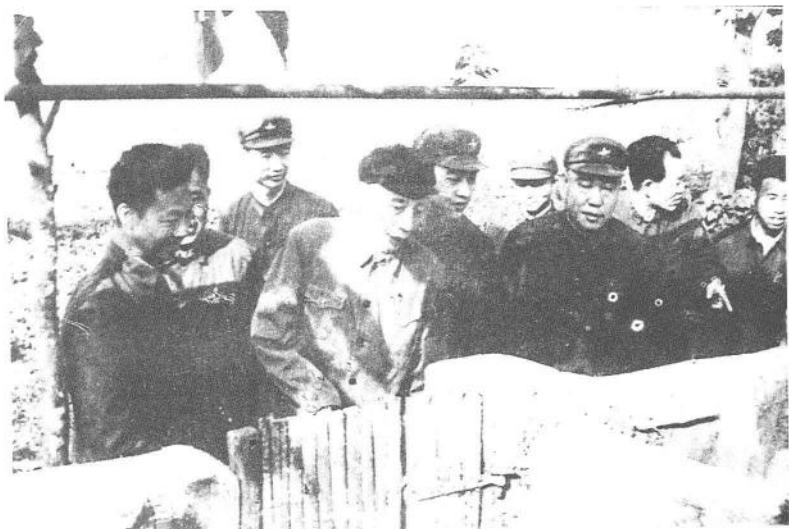
1978年6月4日,王震同志视察红星垦殖场总场职工食堂养猪场。