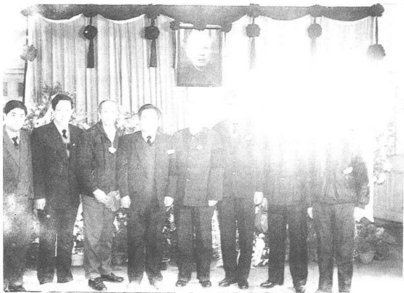
1993年3月18日，抚州地区及红星企业集团代表赴京沉痛悼念王震同志。