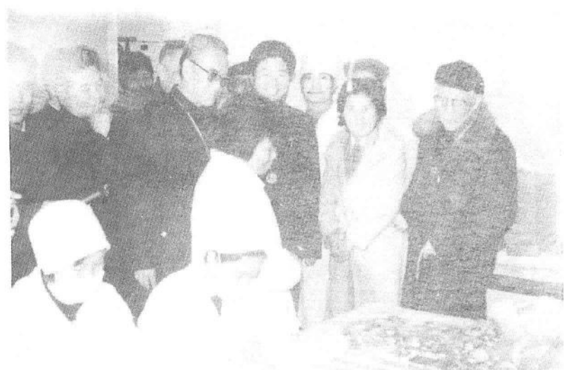
1985年12月5日,王震同志在万绍芬(右二)等同志的陪同下,视察红星食品厂巧克力生产线。