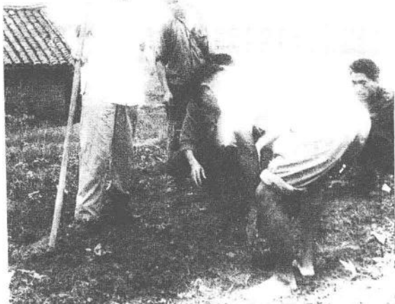
1970年春， 王震同志在红星 一连亲自指导农 工科学栽插红 薯。