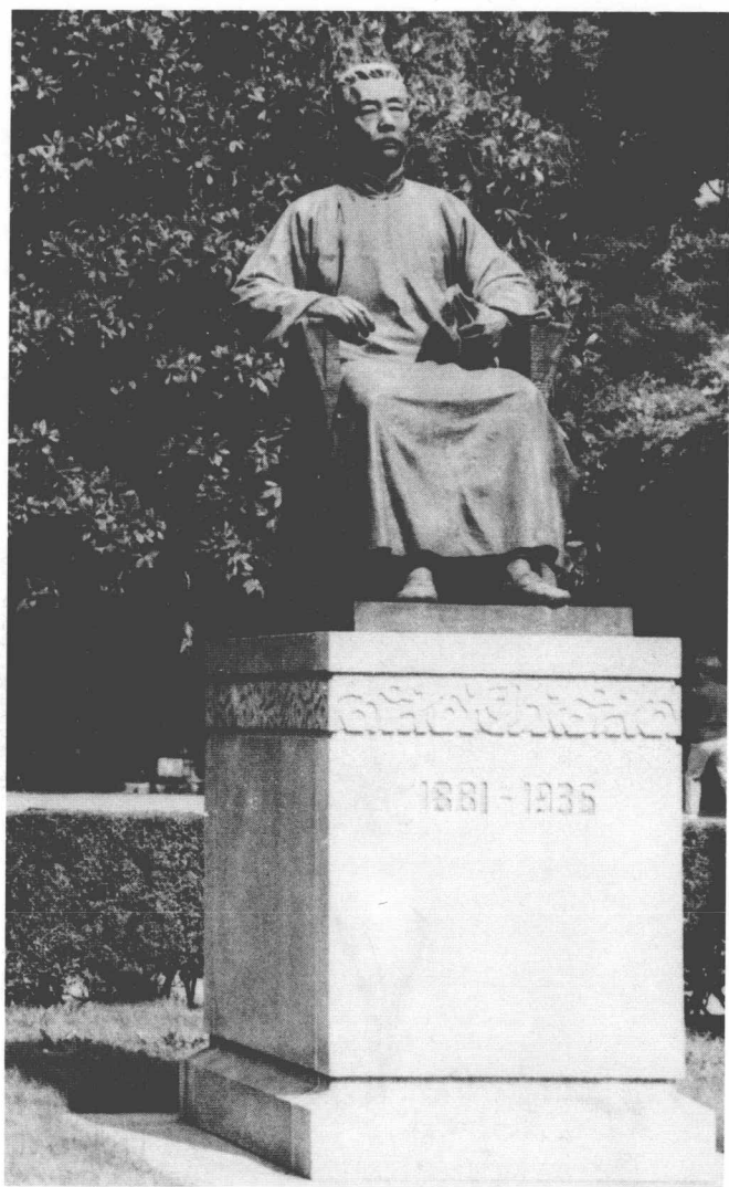
上海鲁迅书园鲁迅坐像