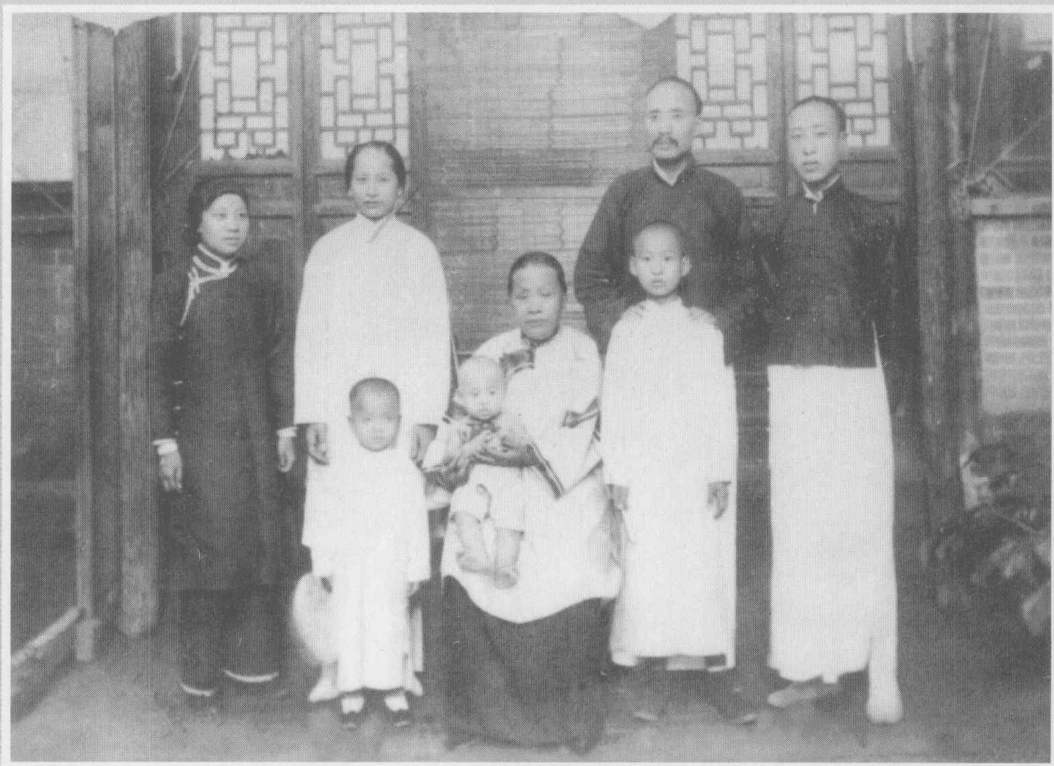
张伯苓与母亲、妻子、弟、妹及孩子。