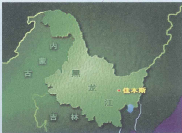
三江平原上佳木斯的地理位置

站在三江口的江岸,人们可以清清楚楚地看到不同颜色的黑龙江水和松花江水在这里汇合后再流向下游,在那里形成了一道天下少有的自然奇观:黑龙江从大兴安岭发源地平缓地流淌而来,水颜色较深;松花江水缘于流淌途中江道土色有关,水中含泥沙成分偏多,水色略黄、较为浑浊;两股江水在此相遇后,产生大量旋涡。站在三江口岸上观其“两江合一”景观,无不惊叹喝彩。每逢遇有大涝之年,三江汇合处显见水位增高,水急浪大,惊涛拍岸,流速湍急,滔滔东去,更加壮观。但无论水流如何急迫,“会师”后的江水始终保持自身原有