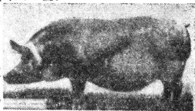
(圖 2. 泰華斯豬)

形態及特性 頭長而直，口部狹小，面稍凹，耳挺立而向前傾，體呈鐵鏽的赤黃色，或灰白色兼褐色斑紋，而以毛作金赤色及皮膚作肉色而無黑斑者為最良。體質強健，易肥