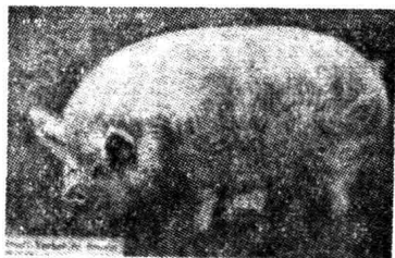
(圖 4. 小型約克斯豬)

形態及特性 此豬頭甚小, 面短縮, 口頗闊, 鼻端向上屈曲, 頰部充實, 耳薄聳立, 脛粗短而背寬。體形豐滿, 極為肥胖, 骨格細小, 體格強健, 全身被純白色細毛, 肌肉甚厚, 四肢短小, 性質溫良, 易於肥育, 成熟快速, (七八個月即能成熟) 結果尤甚佳良, 適於肥肉之用, 孳生力較大, 中白為弱, 每胎僅產兒五六頭, 成熟後體重約二百五十磅內外。