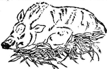
(圖 1. 野豬)

馴化而來。歐洲野豬多生於歐洲北部及北非洲的山野, 牠喜歡居住在繁茂陰濕的闊葉樹林裏, 晝睡, 夜間出到田野, 以鼻端和長牙掘地覓蘿蔔、甘藷、蔬菜、蚯蚓、甲蟲等爲食, 時常損害田間的農作物。牠的體格高大, 瘠瘦而強壯, 身長 3.5—5