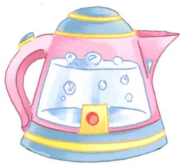
幼儿安全常识·居家安全 真果果 主编

出版发行 中国人口出版社 印 刷 北京市凯鑫彩色印刷有限公司 开 本 889毫米×1194毫米 1/20 印 张 8 版 次 2013年1月第1版 印 次 2013年1月第1次印刷 书 号 ISBN 978-7-5101-1473-1 定 价 50.00元(全5册)