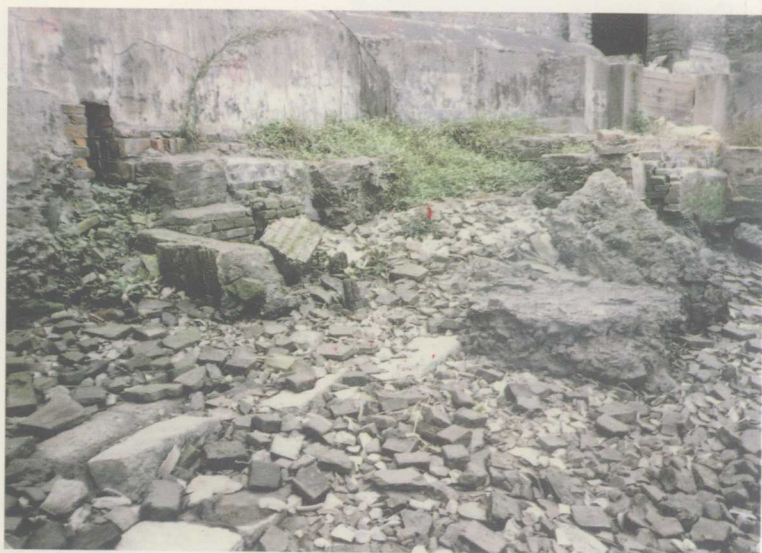
大通港古堤遗迹