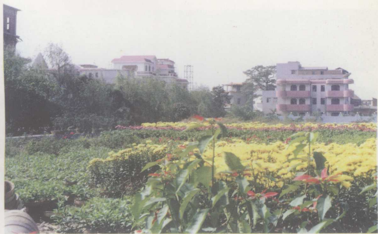
抗日根据地——凤溪新貌