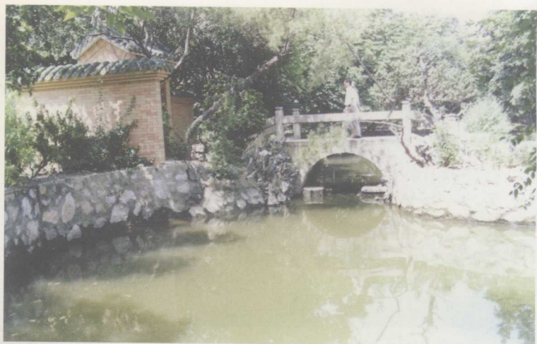
醉观公园仅存的东园遗物建于乾隆年间的石拱桥