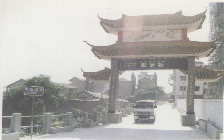
红色游击区老革命根据地裕安围新貌。