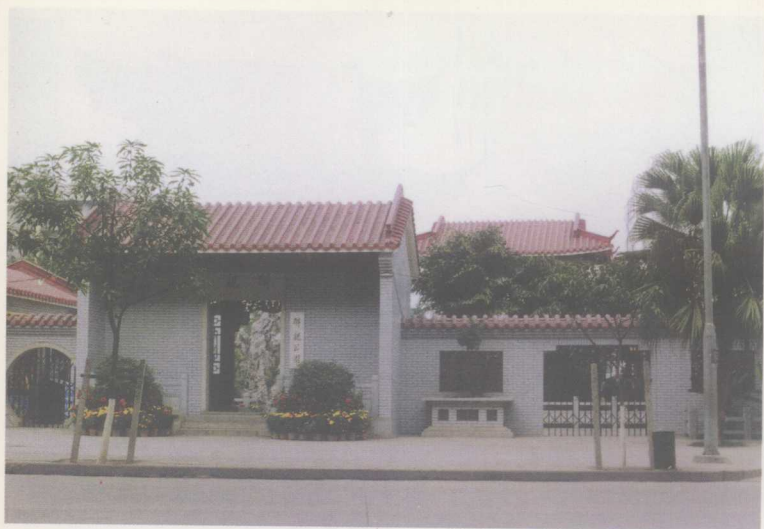
醉观公园正门