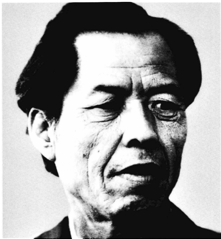
作 者 像