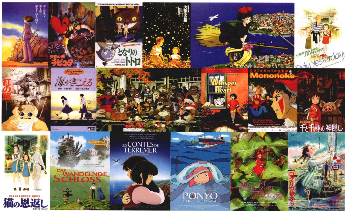
图1-14 吉卜力工作室作品海报

这位坚决反对当代人在幼儿园就教小孩子识字 的艺术家，非常相信：“童年不是为了长大成人而存在的，它是为了童年本身，为了体会身为小孩才能体验的生命经验而存在的。童年时5分钟的经历，甚至胜过大人一整年的经历。创伤也是在这个时期形成的。” ① 事实上，他的作品就是这样重视地反映出他自己的信念，也追逐着自己的梦想。