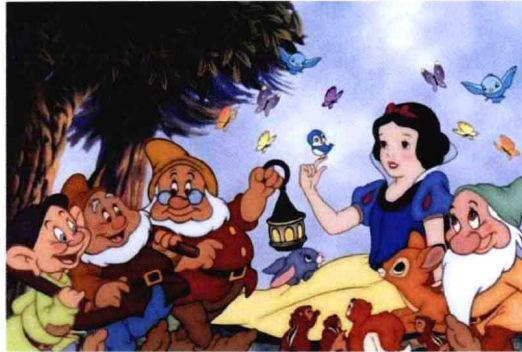
图1-9 《白雪公主和七个小矮人》 世界上第一部长篇卡通电影