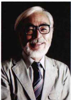
图1-11 动画大师 宫崎骏

1985年宫崎骏创立了吉卜力工作室（GhibliStudio）（图1-13），开始制作《天空之城》、《龙猫》、《红猪》、《魔女宅急便》、《幽灵公主》、《千与千寻》及《哈尔的移动城堡》等长篇动画作品。经过20年的努力耕耘，其累计作品总数虽然不到20