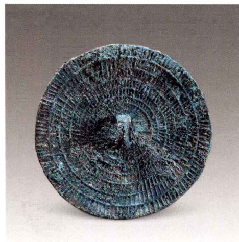
图三 同心圆镜 商晚期 中国社会科学院考古研究所藏