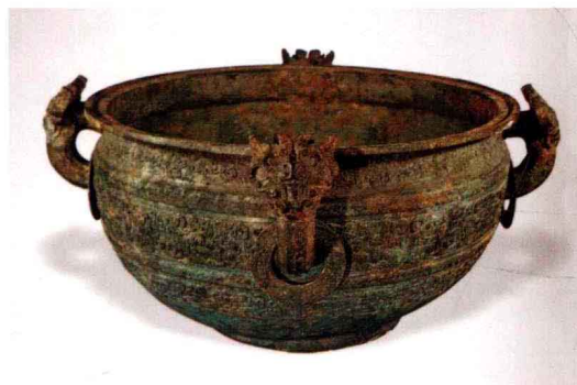
图五 夔凤纹鉴 春秋 山西太原金胜村赵卿墓出土，一组四件，形制、规格相同