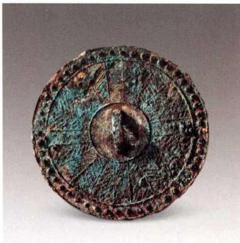
图二 叶脉文镜 商晚期 中国社会科学院考古研究所藏