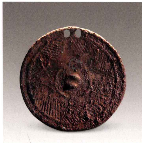
图一 七角纹镜 齐家文化 青海省博物馆藏

这些铜镜的纹饰，则与一同出土的青铜器中饕餮纹、云雷纹等纹饰完全不同，而呈现出以镜钮为中心，用长直线或短直线，刻画出繁缛细密的放射状细线纹，向镜缘区辐射。这是最直观、最典型的太阳芒纹，本书第001号镜便是这样一件重圈放射状太阳芒纹镜。不仅铜镜，从各类早期石刻纹饰、陶器纹饰、玉器纹饰中我们不难发现都有大量的太阳纹饰。能够照射万物，泽被苍生的太阳无疑是古代先民最为崇拜的对象，而铜镜能够反射阳光，在先民的意识里，就是太阳的化身，可以说，早期铜镜，首先是远古先人太阳神崇拜的神器法物，其主要功能在祭祀天地等各项宗教活动中，起着沟通天地神人的作用，是降魔驱瘟的神物。宋新潮先生也认为：早起铜镜“是巫师做法最重要的法器。被视为‘神镜’”，“除用于照容外，还具有宗教方面的用途，或许是更主要的用途。” 【7】 这样的太阳光芒纹饰之后便演化成为一种纹饰元素，不仅在早期镜中出现，在后期的战国、两汉铜镜中也大量地应用到这种纹饰元素，如栉齿纹即是这种元素。本书第156号四凤芒纹镜虽时代较晚，但依然明显地承接了早期太阳芒纹镜的遗风。