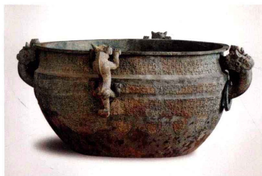
图四 吴王夫差鉴 春秋 中国国家博物馆藏