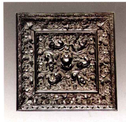
图六 方形海兽葡萄纹镜 日本正仓院藏

不仅如此，在道教的各种咒语中，与镜有关的就有“安灯放镜咒”、“点灯立镜咒”等等不同咒语。故李时珍的《本草纲目·金石部》中语：“镜乃金水之精，若有神明，故能辟邪魅忤恶。凡人家宜悬大镜，可辟邪魅。”本书第253号即为宋代钟形带环双剑铭文镜，镜背纹饰为鼎形炉与火焰宝珠，左右各有一剑，配之以铭文。此镜纹饰内容反映了道教活动中镜与剑合二为一的法器功能。第254号宋代道教丹坛宝鼎龙虎异型镜则非常罕见，镜缘以七出菱花包围，构成了一个不规则的几乎长方形镜体。主纹饰区顶部为一尊炼丹鼎炉；两侧左虎右龙，分别降服于其头顶云气缭绕的道剑之下，龙虎之间是道教炼丹用的龙虎丹台。炼丹是道教的核心法门，也是修真炼性，羽化成仙的重要手段。此镜所表现的，正是按照宋代道教仪轨，修真练气，降龙伏虎，炼丹作法的真实场景，而铜镜本身，也应为宋代文献中“上去药鼎三尺垂古镜一面”的记载，是炼丹过程中使用