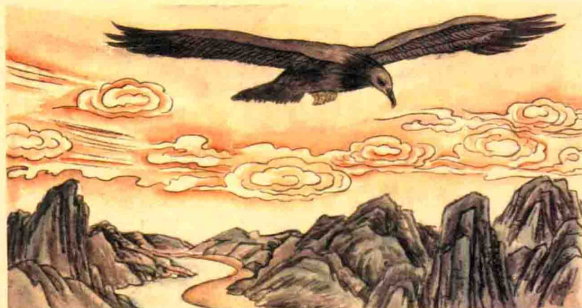
鲲变成鹏，鹏的背不知有几千里。