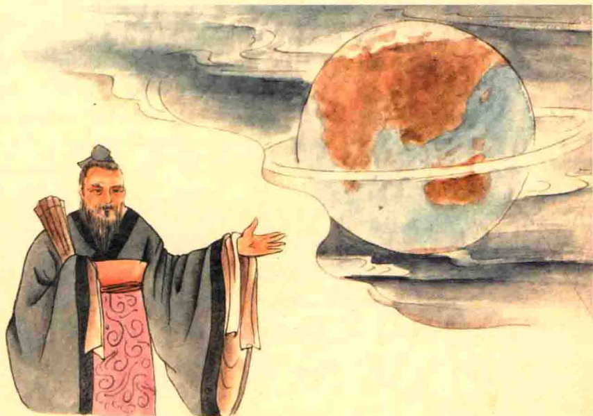
顺应自然规律，把握六气变化。