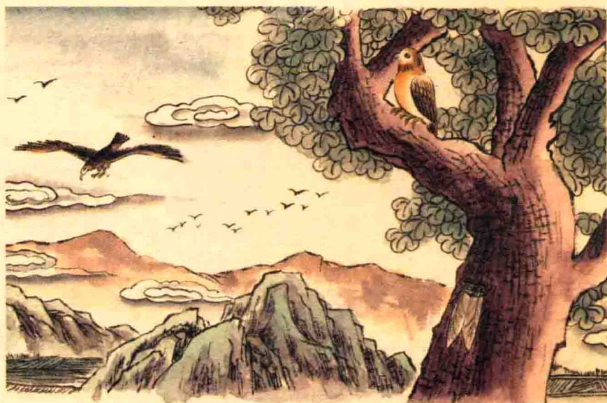
蝉和学鸠讥笑大鹏。

蜩与学鸠笑之曰 ① ：“我决起而飞 ② ，抢榆枋而止 ③ ，时则不至而控于地而已矣 ④ ，奚以之九万里而南为 ⑤ ？”适莽苍者 ⑥ ，三飧而反 ⑦ ，腹犹果然 ⑧ ；适百里者，宿春粮 ⑨ ；适千里者，三月聚粮。之二虫又何知 ⑩ ！”