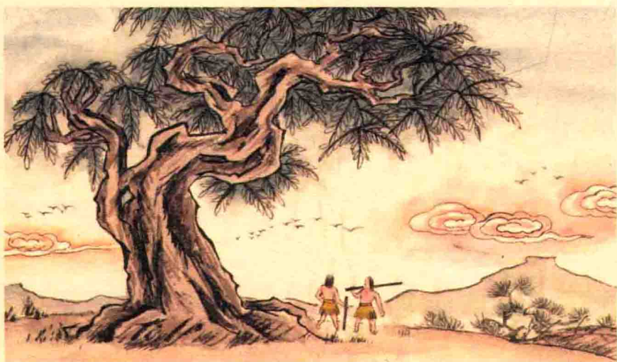
上古时有大椿树，以八千年为一春，八千年为一秋。

小知不及大知 ① ，小年不及大年 ② 。奚以知其然也？朝菌不知晦朔 ③ ，蟪蛄不知春秋 ④ ，此小年也。楚之南有冥灵者 ⑤ ，以五百岁为春，五百岁为秋；上古有大椿者，以八千岁为春，八千岁为秋，此大年也。而彭祖乃今以久特闻 ⑥ ，众人匹之 ⑦ ，不亦悲乎！