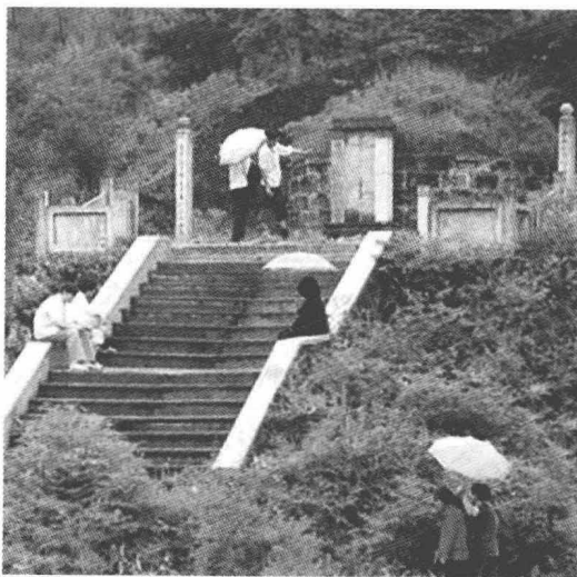
江西铅山县阳原山辛弃疾墓