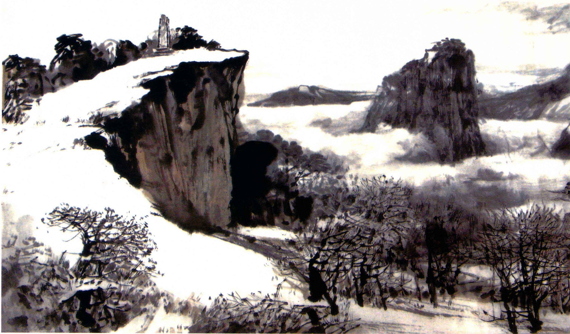
山顶云与山间云各显神韵

云是表现画中意境最好的手段之一。上图是描绘华山初雪及云雪相呼应的景色。在同一幅画面里同时出现两种性质不同的白，其一是表现华山初雪的雪白，其二是表现华山山间白云的白。因两者性质各异，所以在描绘时采用不同的手段，表现不同性质的白。下图是描绘秋季的景色（局部），在表现云雾的方法上采用缓散薄云或朦胧形式，适宜金秋季节。