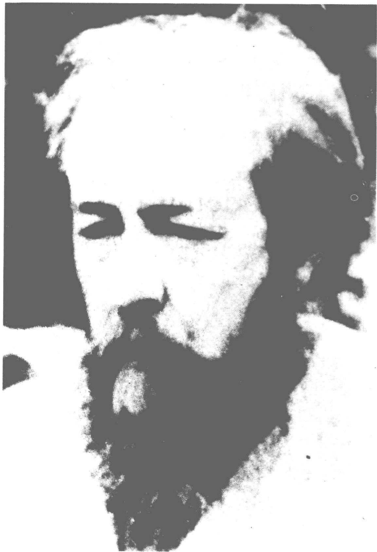
[苏联]亚历山大·索尔仁尼琴(1918—) (1970年诺贝尔文学奖获得者)