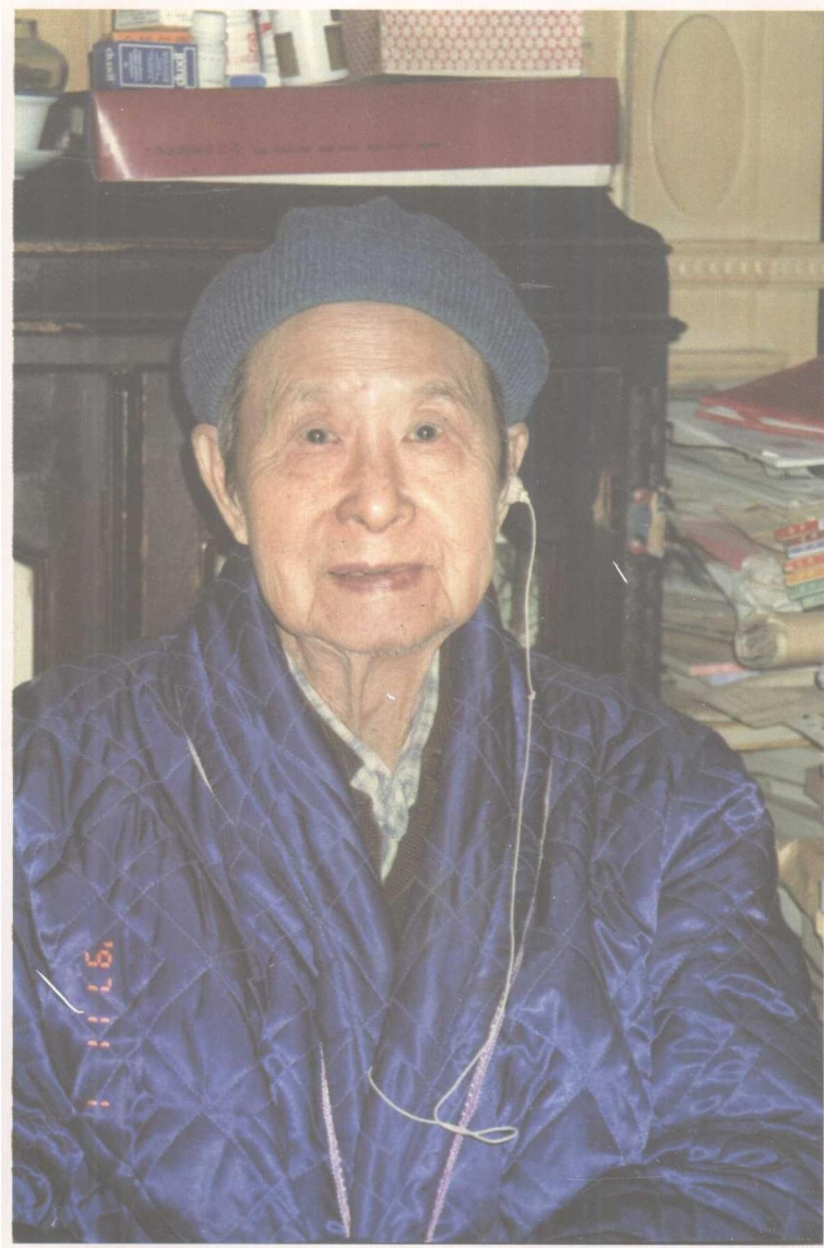
一九九七年于北山楼