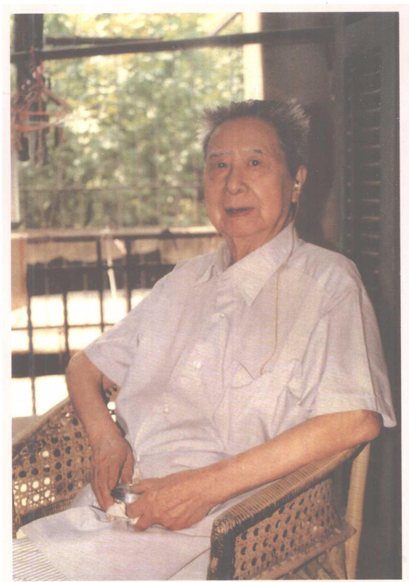
施蛰存 (一九九〇年于上海寓所)