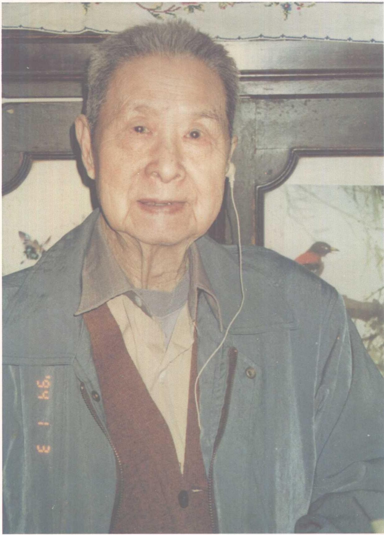
一九九四年于北山楼