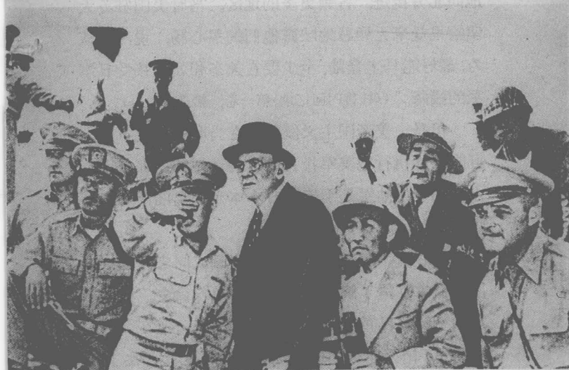
美国总统特使杜勒斯到朝鲜三八线一带，最后审查对共和国北半部的武装侵略计划。(1950年6月18日)