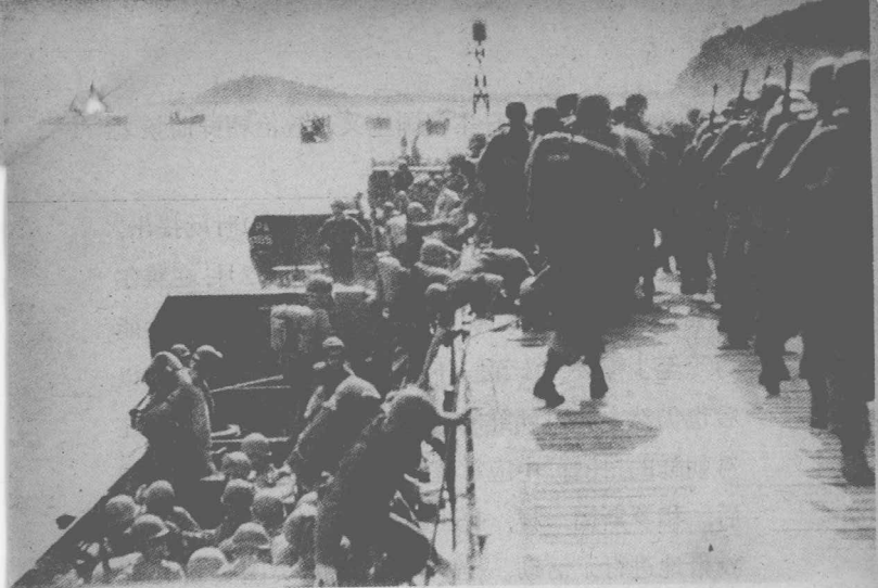
1945年9月8日，美帝国主义侵略军从南朝鲜仁川港登陆，占领了三八线以南全境。