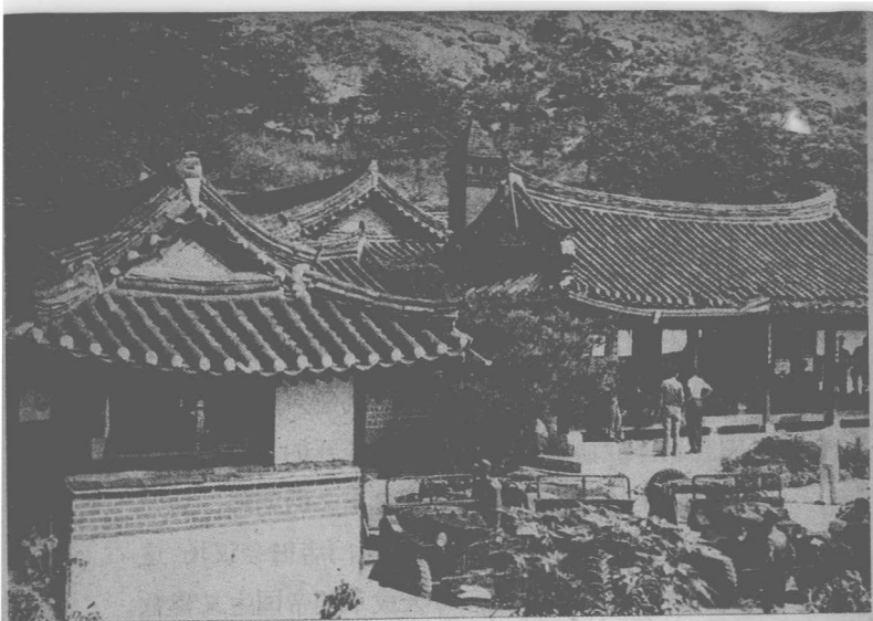
开城市来凤庄。1951年7月，在这里举行第一次朝鲜停战谈判。