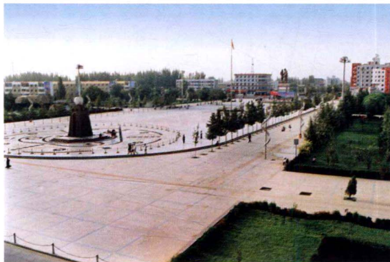
和田市民族团结广场

随着文物考古工作的蓬勃开展，和田地区的文博事业也取得了重大进展。和田地区博物馆新馆于2005年10月正式对外开放，拥有馆藏文物9000余件，其中定级文物500余件。为加强文物的管理和保护，具有代表性的重要文物点已由各级人民政府分批核准、陆续公布为相应级别的文