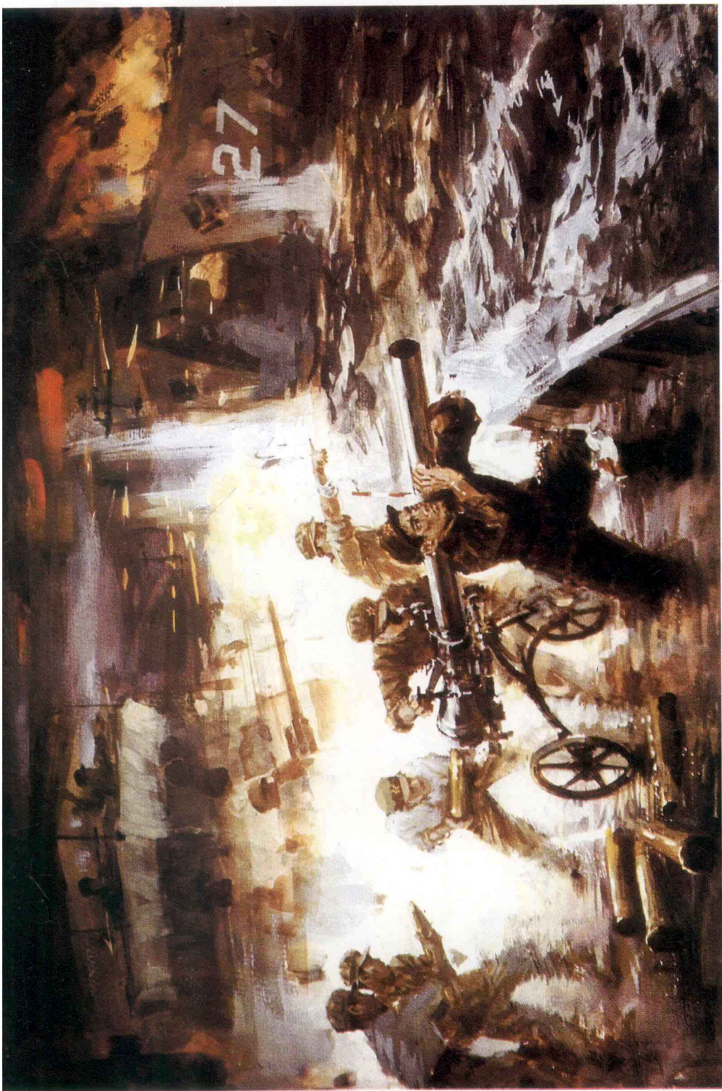
[1] 垃圾尾海战 (水粉画)