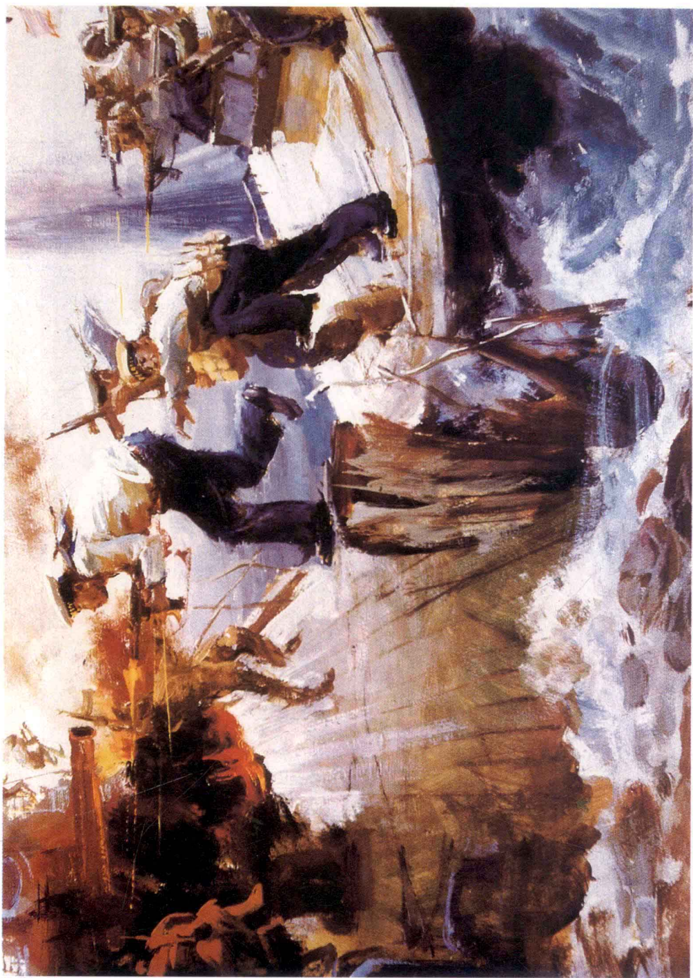
[2] 披山奔袭战 (水粉画)