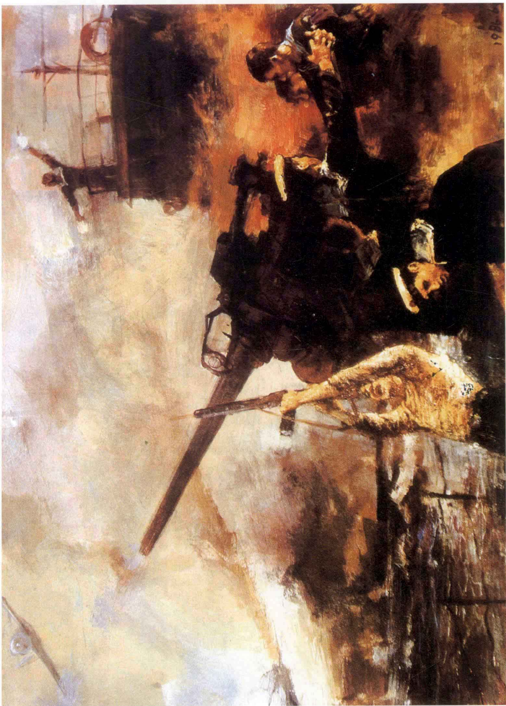
[3] 光荣的“瑞金”舰 (水粉画)