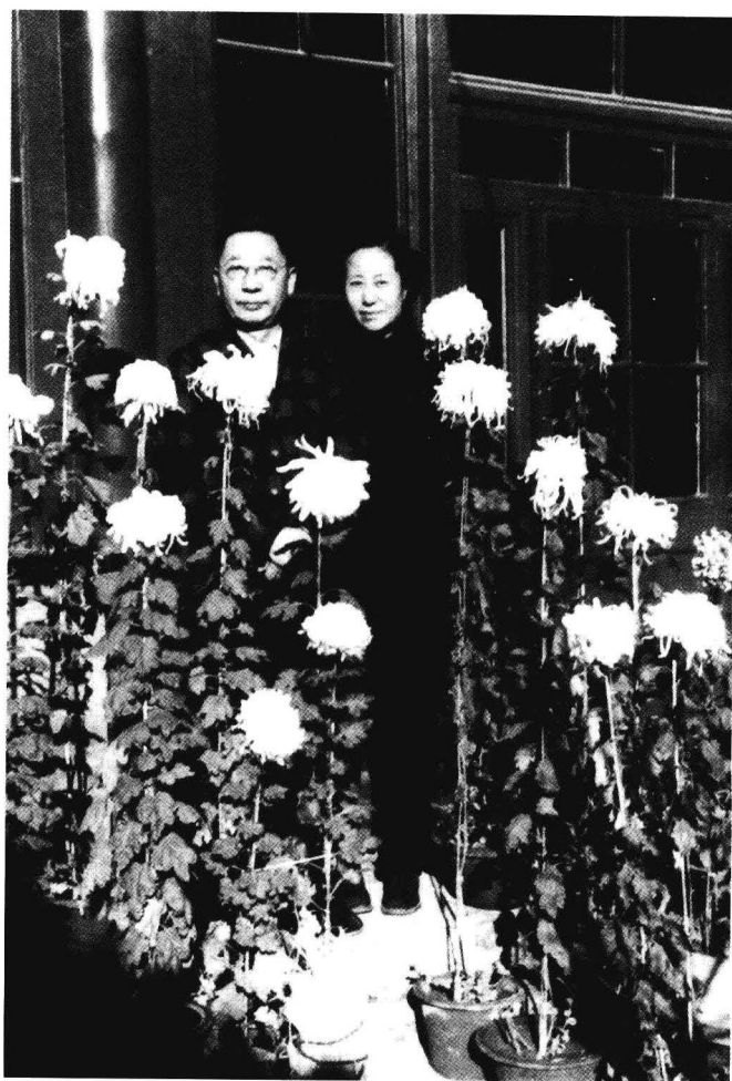
1952年秋老舍、胡絮青夫妇于北京寓所菊花丛中