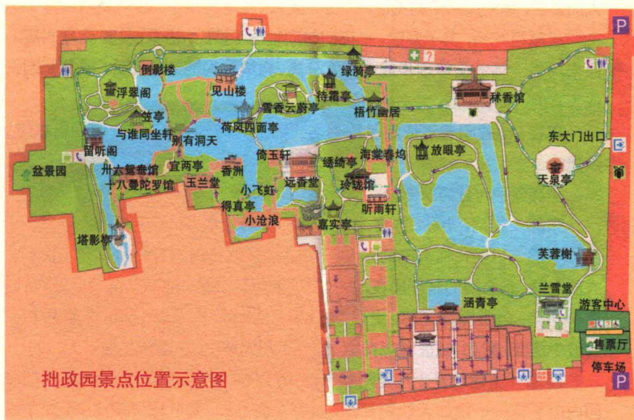
拙政园景点位置示意图