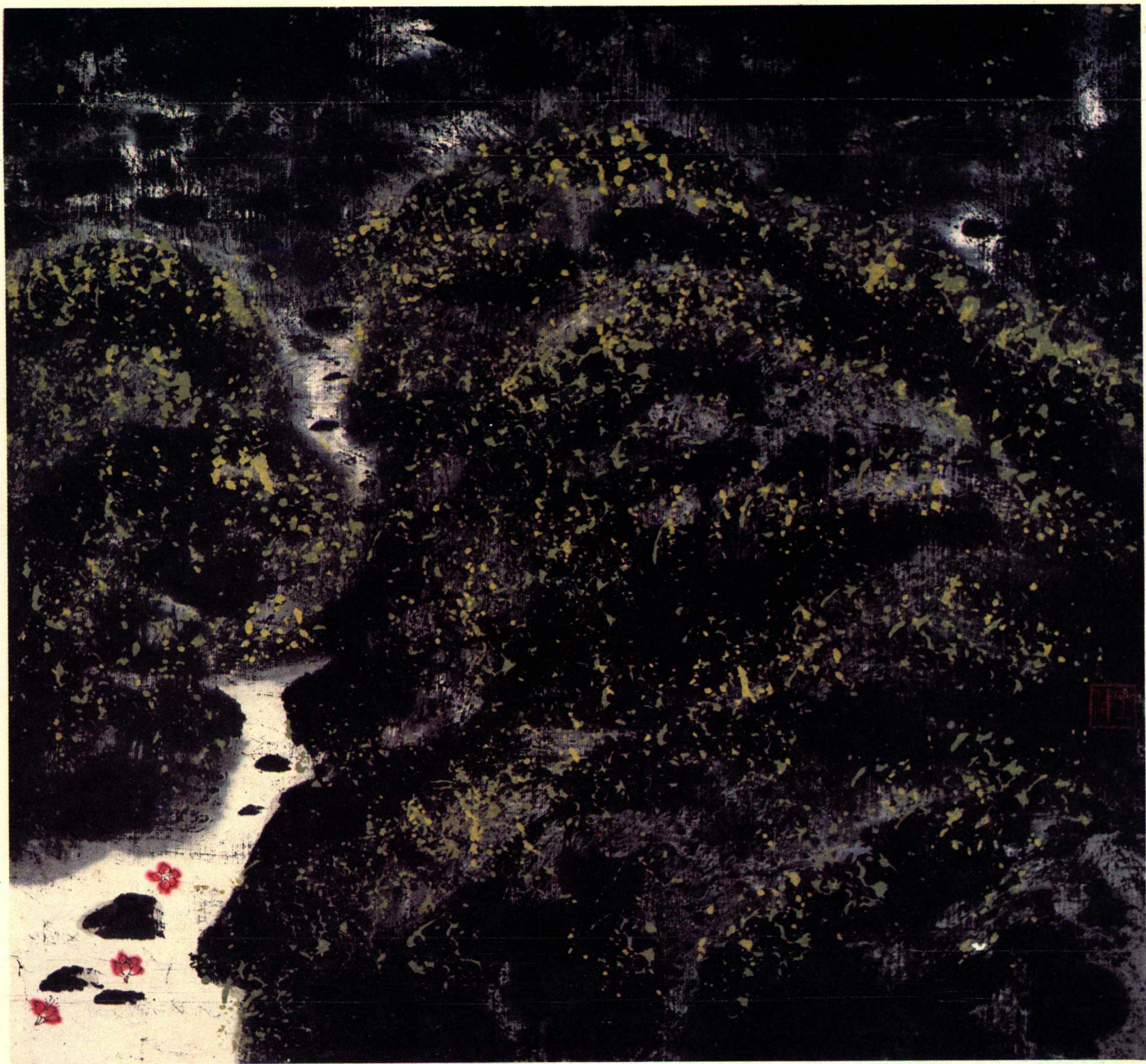
桃源意在深处 涧水浮来落花