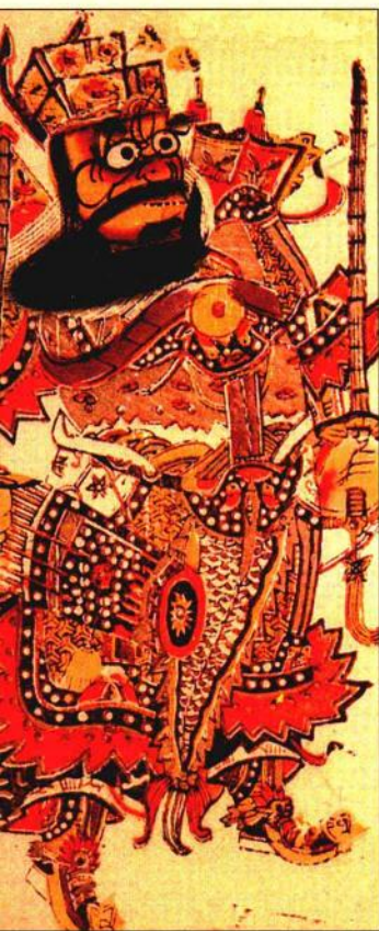
我们看到左边门上所贴的门神——尉迟恭。

算命先生袁天罡摸摸胡子，深深看了龙王一眼，然后闭上眼，嘴里喃喃念了一通，然后说：“明天午时，长安城必定下雨三寸三分。”