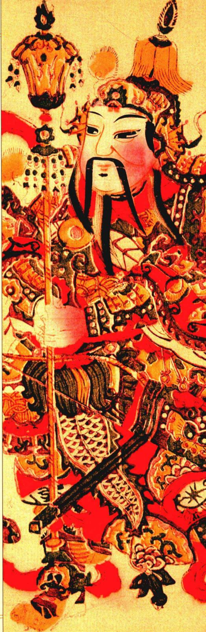
过年时，我们可以看到民家右边门上所贴的门神——秦叔宝。