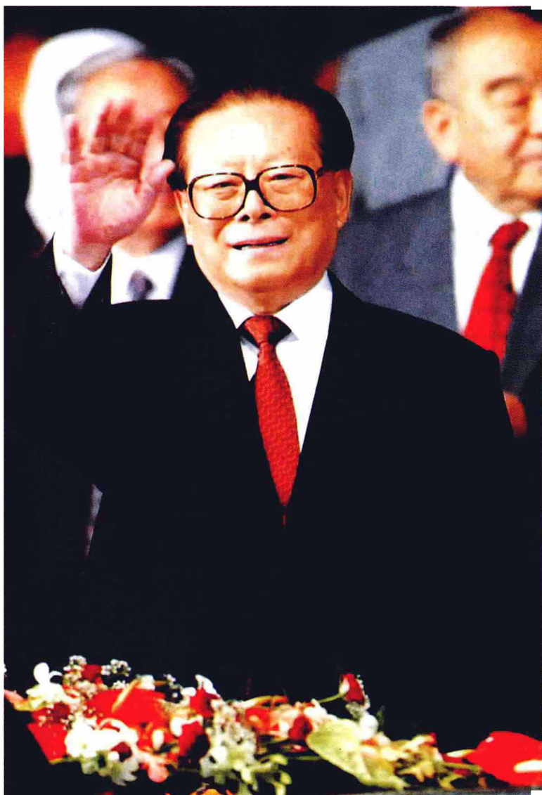
2001年8月22日，第21届世界大学生运动会开幕式在北京工人体育场隆重举行，中共中央总书记、国家主席江泽民宣布运动会开幕。