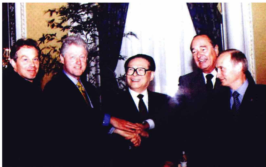
2000年9月7日，由中国倡议的联合国安理会五个常任理事国首脑会议在纽约举行。