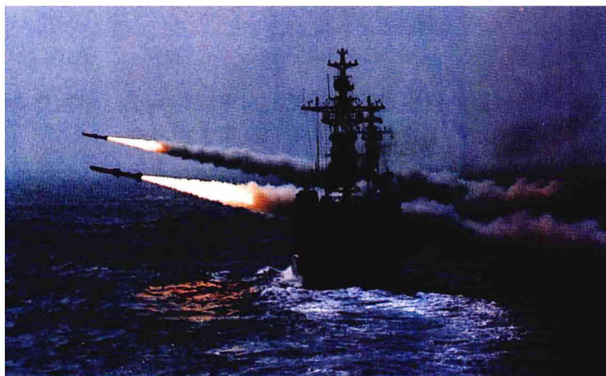
中国海军海上发射导弹