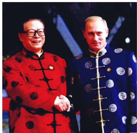
2001年10月19日，中国国家主席江泽民在上海科技馆会见俄罗斯总统普京。