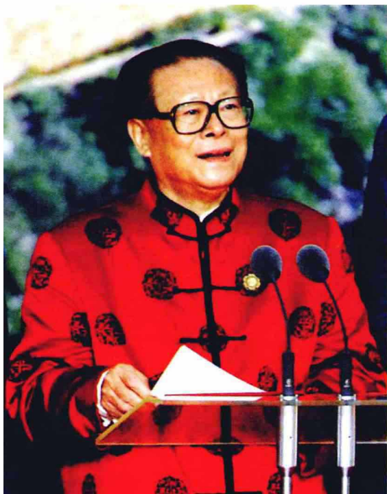
2001年10月21日，国家主席江泽民在上海科技馆宣读亚太经合组织第九次领导人非正式会议的《领导人宣言》。