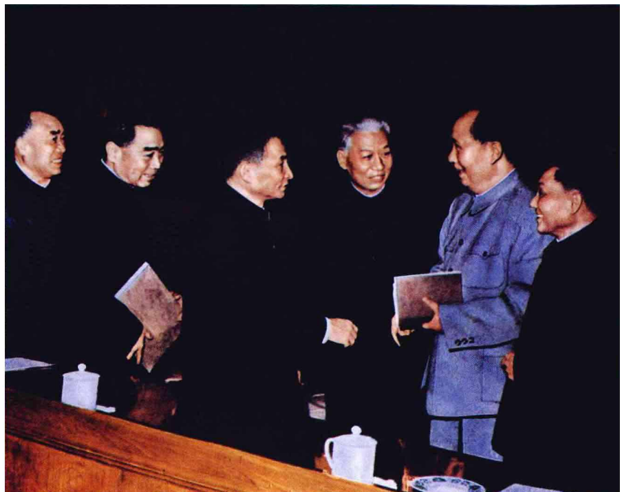
1962年1月11日，中共中央在北京举行扩大工作会议。