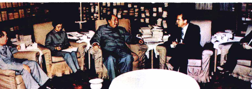
1972年2月，在周恩来总理邀请下美国总统尼克松访华。毛泽东会见尼克松。