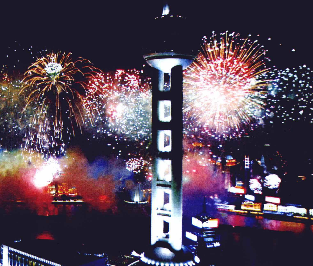
2001年10月20日晚，申城焰火齐放，浦江两岸成为火树银花不夜天