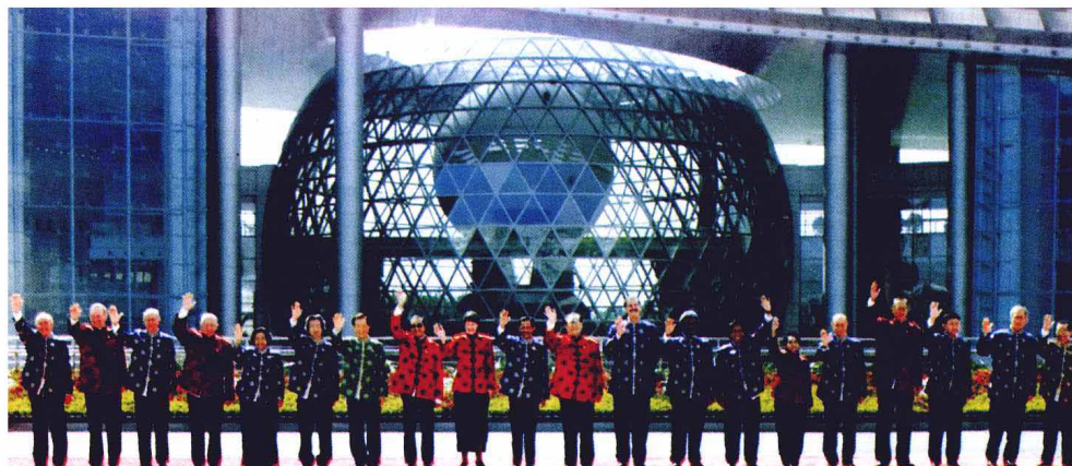
2001年10月21日，参加亚太经合组织第九次领导人非正式会议的领导人身穿中国民族服装在上海科技馆前合影。