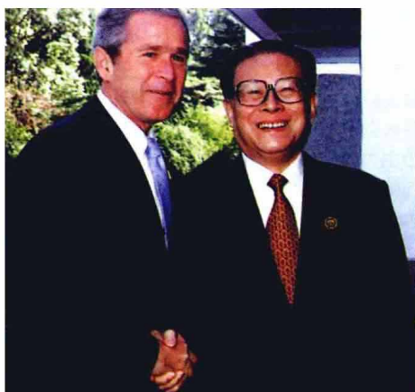
2001年10月19日，中国国家主席江泽民在上海西郊宾馆会见美国总统布什。