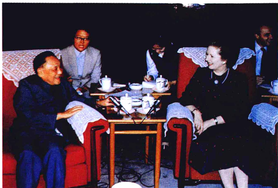
1982年9月，邓小平会见来访的英国首相撒切尔夫人，阐述了“一国两制”的伟大构想。