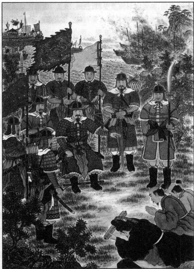
争夺向明朝的朝贡权：日本两个朝贡团在宁波火拼

老和尚还有几分唐玄奘的精神。来北京的时候，已然是八十七岁高龄，而且在此前一年，已经出海过一次，可是取经哪有不经过九九八十一难的，那年船到半路，又被风刮回了日本岛。这不，拼了老命又来了。哎，可是苦了这老和尚了，来北京竟然是为了见当时朝堂之上的一个叫什么王阳明的官员。他说他