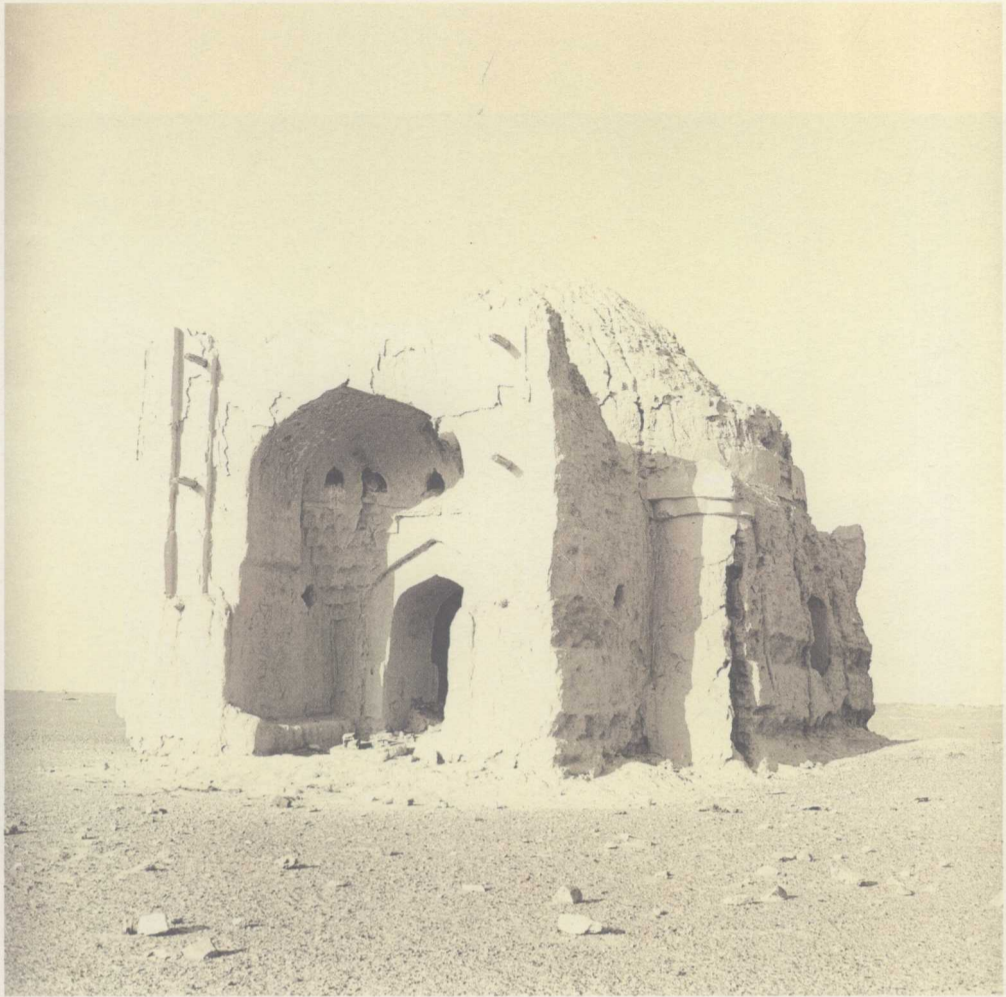
二十世紀八十年代黑水城遺址元代清真寺