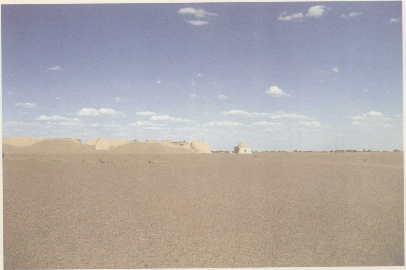
黑水城遺址城外西牆南側