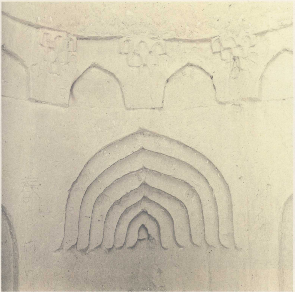
二十世紀八十年代黑水城遺址元代清真寺內部