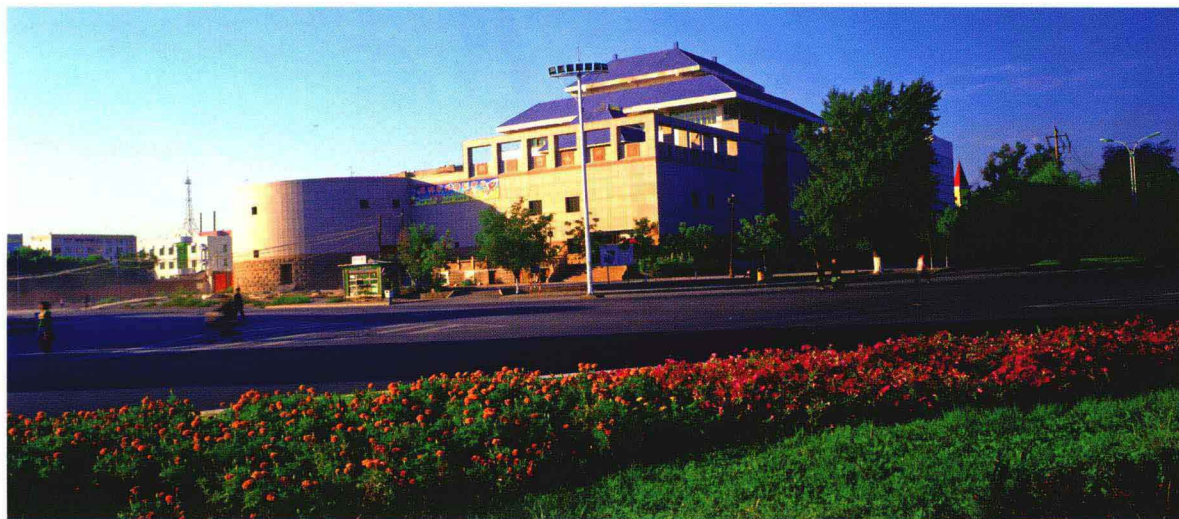
昌吉回族自治州博物馆