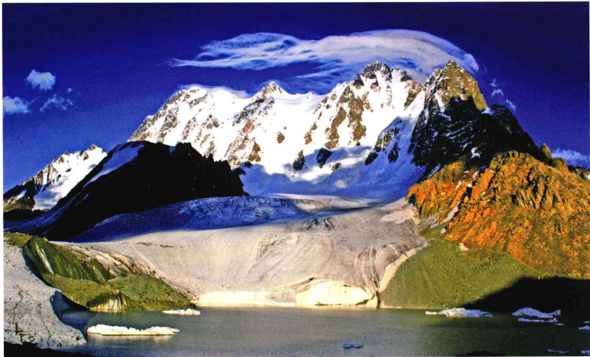
博格达峰