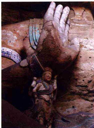
山西大同云冈石窟寺交脚弥勒右臂下的力士

1500余年的岁月风烟，头上的宝冠、面部及羊肠纹菩萨大裙虽受到不同程序的损坏，但其神韵和气势却仍然存在。