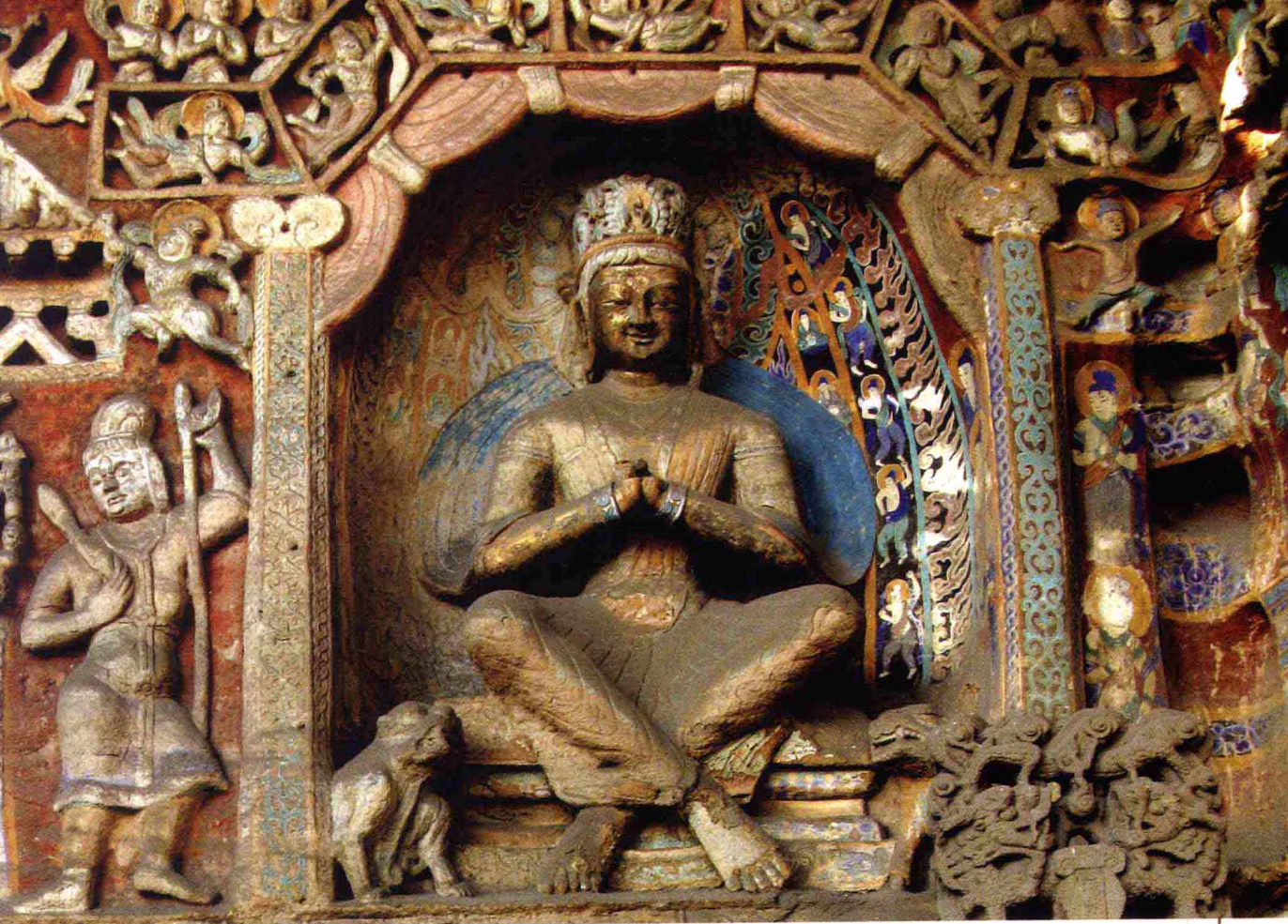
山西大同云冈石窟寺交脚弥勒