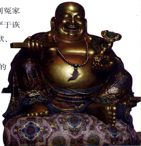
台湾南投县“中台禅寺” 天王殿铜弥勒（现代）

和，是弥勒的魂；宽容是弥勒的本。弥勒的信仰对社会形成一种相互体贴、互相包容、消解矛盾、积极进取、扩展胸怀的良好风尚有很大的帮助。因此，我们可以说，弥勒不仅是中国佛教的形象大使，也是中华民族的形象代表，在当今创建“和谐”社会的环境中，弥勒的造像更有特殊的意义。