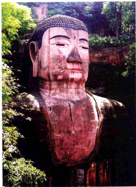
四川乐山大佛头像

中国最大的如来装弥勒大佛叫“乐山大佛”。乐山大佛在四川乐山市东部500米处的凌云山,故又名“凌云大佛”。大佛依凌云山的山势开山凿成,面对岷江、大渡河和青衣江的汇流处。大佛高71米,肩宽24米,头高14.7米,眼长3.3米,耳长7米,脚背到膝高28米,脚背宽8.5米,脚上可围坐上百人。