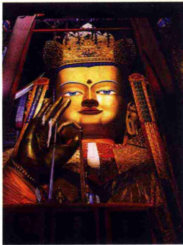
西藏日喀则札什伦布寺中的大铜像“强巴佛”

其他如山西大同云冈石窟的两尊交脚弥勒也是菩萨装的弥勒，两尊弥勒均雕凿于北魏孝文帝年间（公元460年），一尊高为13米，另一尊高为15.6米。值得一提的是13米高的那尊弥勒的巨大右手放在胸前，这只悬在胸关的手时间久了可能会出现断裂，古代艺术家便巧妙地在右手腕下雕有一个托臂的力士像，为这只手起了支撑的作用。这两尊交脚菩萨装的弥勒造像经历了