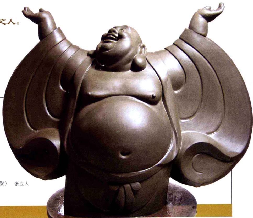
和谐满神州(泥塑) 张立人