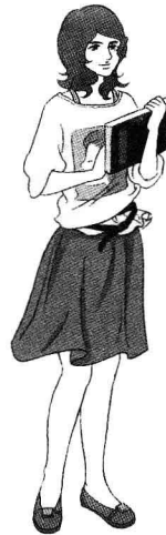
林娜：女，法国留学生 Linna: female, a student from France