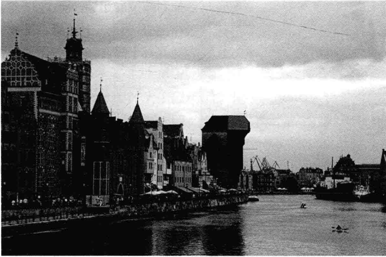
圖 2：格但斯克河畔 自漢薩同盟時代以來，格但斯克始終是波羅的海沿岸地區一個重要的航運與貿易中心，雖然在歷次的戰亂中幾度衰落，但之後都能夠利用其區位優勢，恢復過去的繁榮。格但斯克在歐洲政治、軍事與外交史上，佔有相當重要的地位，一直是德意志和波蘭兩大民族爭奪的主要地區，二次戰後才變成一個道地的波蘭城市，該地亦是團結工會的發祥地。

船廠、石油化工、機械和食品加工工業中心，擁有兩個海港，2008 年人口約四十五萬五千人。近年來，格但斯克已與索波特 (Sopot)、格丁尼亞兩市聯合形成龐大的港口城市，成為一個三聯市。