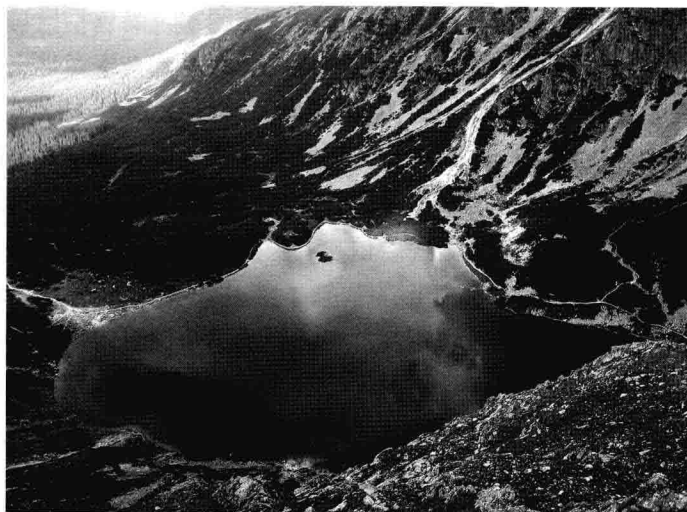
圖 4：塔特拉山脈 山脈所形成的起伏山谷，提供各種不同難度與時間長短的登山步道，也是當地冬季最佳滑雪勝地。由於山區特殊的喀斯特 (Karst) 地形，共有四千多個鐘乳石洞。