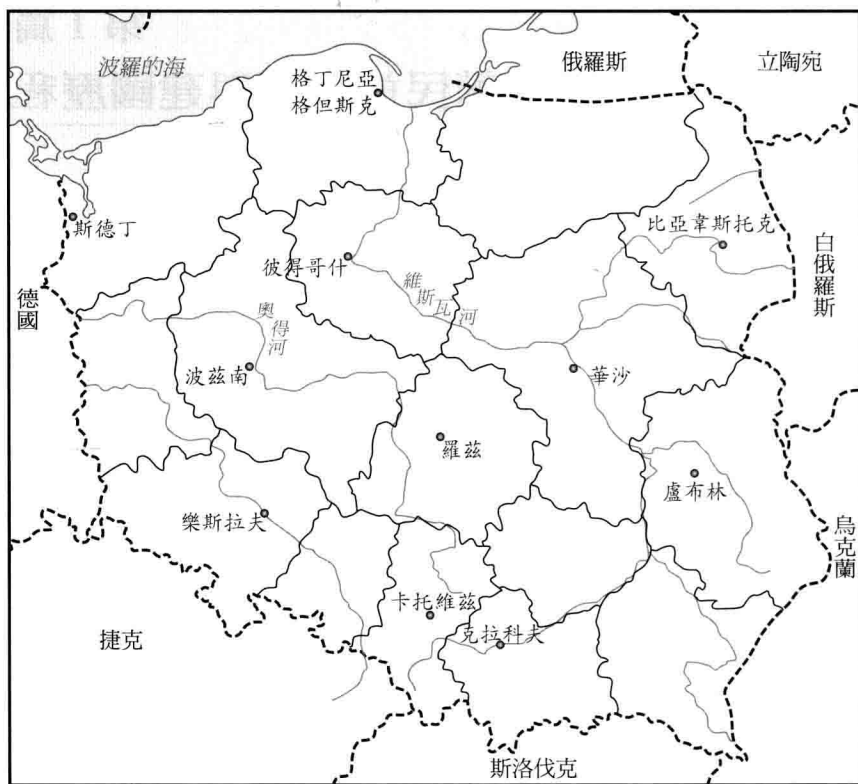
圖 1: 波蘭地圖