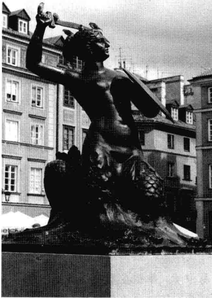
圖3：華沙的象徵——美人魚 雕像位於華沙舊城區。相傳曾有一位國王來到維斯瓦河畔一座風景秀麗的村落，突然有一條美人魚從河裡跳出，為國王唱了一首優美動聽的歌曲。國王立即愛上了這個地方，決定在這裡建都，並以在附近嬉戲的兩個小孩子之名——“Wars”、“Sawa”，作為這個地方的名稱，即「華沙」之名的由來。

便利而發展迅速，至1938年，人口已達一百二十六萬，戰後一度減為五十萬，2008年則為一百七十萬七千餘人，尤以棉織業及金屬工業特為興盛。羅茲位處華沙西南方，位於北部平原與中部臺地之漸移地帶，2008年人口為七十五萬人，為波蘭第二大都市，且為波蘭最大之紡織工業都市。