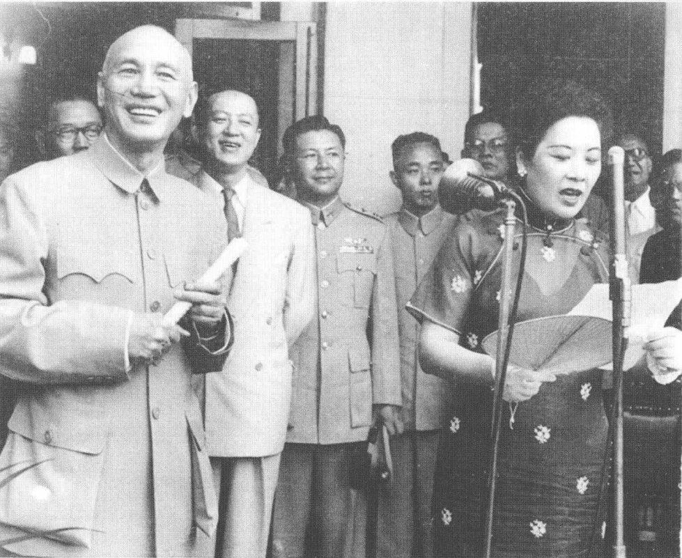
蒋介石与宋美龄出席某次群众活动

前的最高年产量。职工平均工资提高 70%左右,农民收入一般增长 30%以上。大陆经济稳定,人民安居乐业,实际上他们的生活比台湾军民要好得多。这幅“大陆恐怖图景”只是蒋介石编造出来对军民进行“教育”的新资料而已。