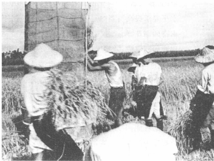
50年代台湾农村的收割景象