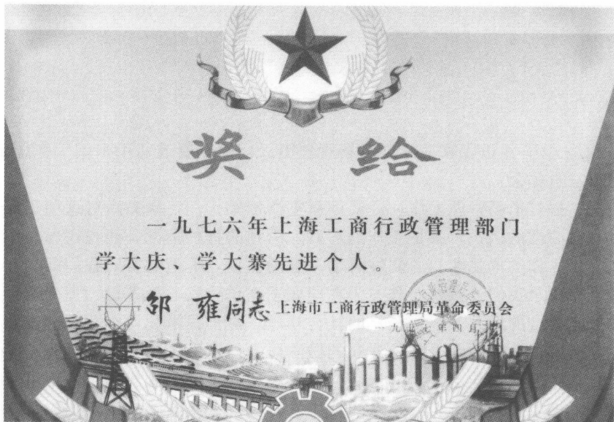
1977年上海市工商行政管理局奖状

放行的处理意见往往想不通，而没有想到不分情节轻重。不分主次，乱扣乱罚是党的政策不允许的。在各类案件中，属于人民内部矛盾的通常总是占绝大多数。对于走上歧途犯了错误的人，一定要运用党的政策不厌其烦地去说服他们、挽救他们。在经办大案时，只要正确地掌握政策，就能够分清主次，做到稳准狠地打击犯罪分子。