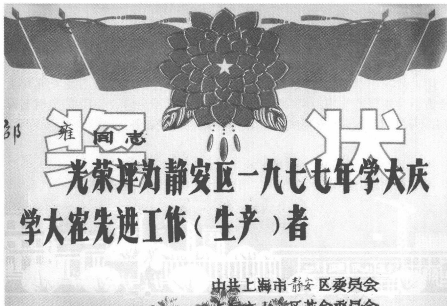
1977年静安区先进工作者奖状