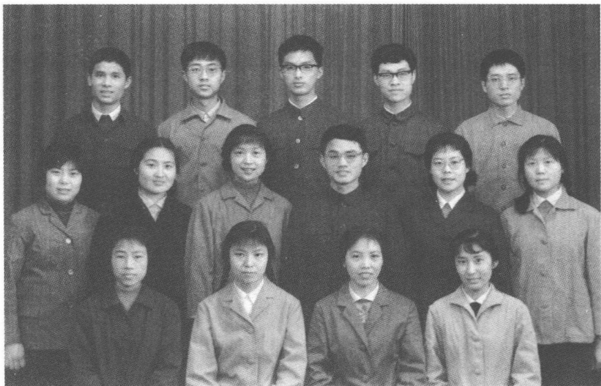
1978年街道机关青年合影

最近再次认真学习了党的《关于建国以来若干历史问题的决议》，联系自己的实际，更深切地体会到“文革”是一场由领导者错误发动，被反革命所利用，给党、国家和各族人民带来严重灾难的内乱，不可能是任何意义上的社会进步。当时参加哪个派的群众组织都是错误的。在“文革”中越是积极，越是陷得深。自己尚未陷得很深是有原因的。