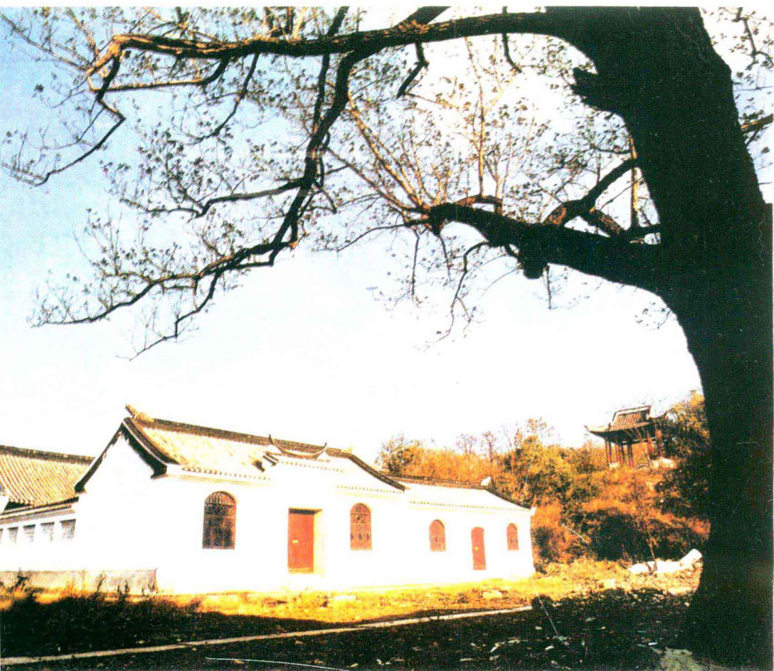
南京王安石故居半山园