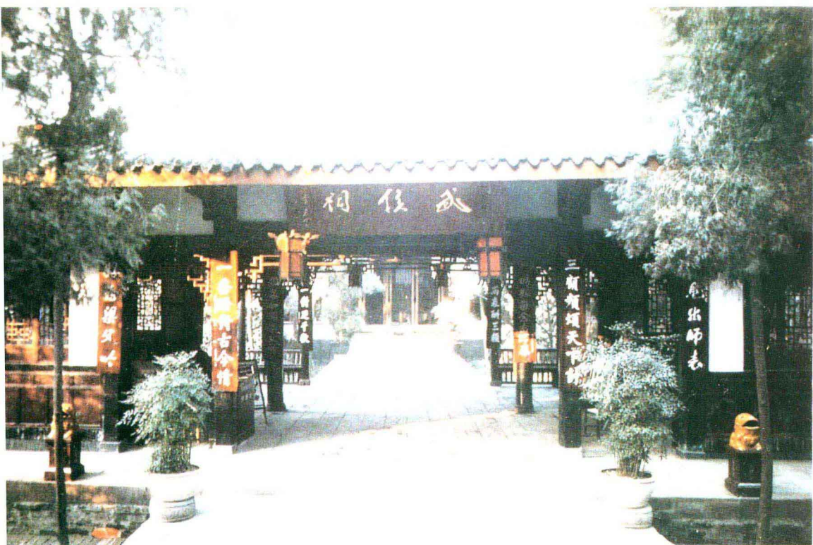
诸葛亮祠堂——武侯祠