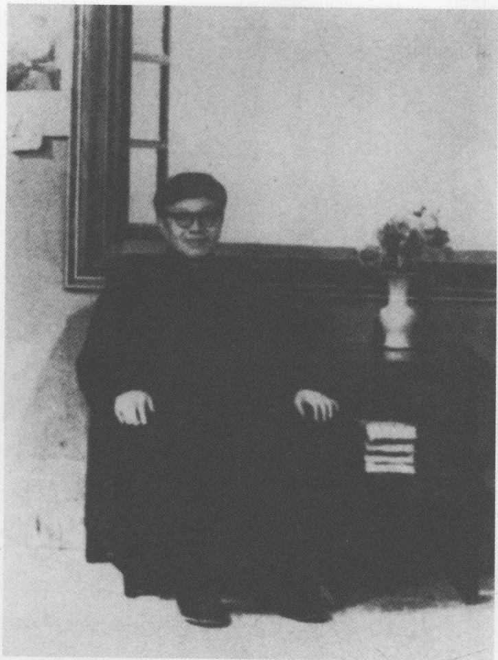
张闻天在广东肇庆市（1975年）