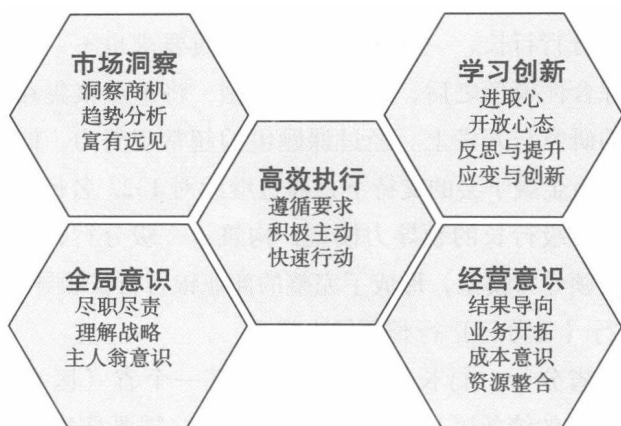
图2 二级分行行长领导力模型图