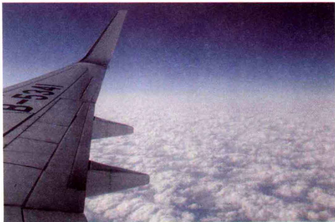
◎一路向北，与天使同行

不一会儿，空姐开始分发早餐，果然一如既往的简洁（或者说是简陋），我选了中式粥餐，“阿部宽”则要了西式火腿。机舱内的人很安静，我很喜欢这种氛围，可以想事情。在国内航线的时候，常常恨不得打开舱门，将那些低级的阿猫阿狗通通踢到下界，于是整个世界便清静了。向窗外