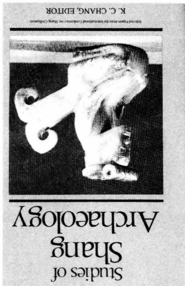
《商代考古研究》英文版，1986年