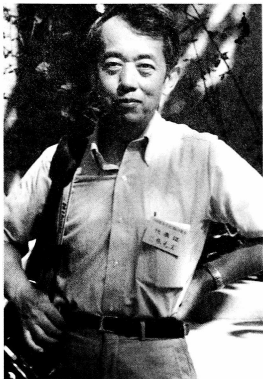
出席殷商文化讨论会，安阳，1988年