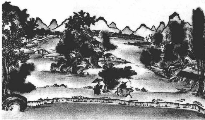
▲ 清明杏花村图 (清)

阴，惜秋敬老，万寿无疆。这个年节体系，盖以自然节气的规律性变化为依托，宛如一幅自然节候的流程图。这是在天人合一的宇宙观下人与自然融为一体、充溢天人之情民族生活时间表。