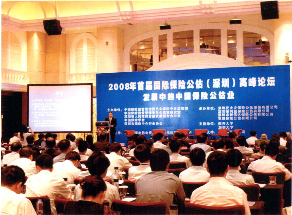
深圳保险中介行业不断创新发展，成为推动保险试验区建设的重要力量。目前深圳正在努力建设全国“保险中介之都”。图为2008年5月29日首届国际保险公估（深圳）高峰论坛现场（目前已更名为“国际保险中介论坛”）。