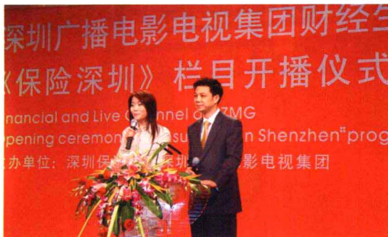
深圳开展保险宣传创新，在全国率先推行保险宣传进社区，率先与电视媒体合作创办保险宣传电视栏目。图为2006年9月21日保险宣传进社区晚会现场、社区保险宣传栏和2006年8月8日《保险深圳》电视栏目开播仪式现场。