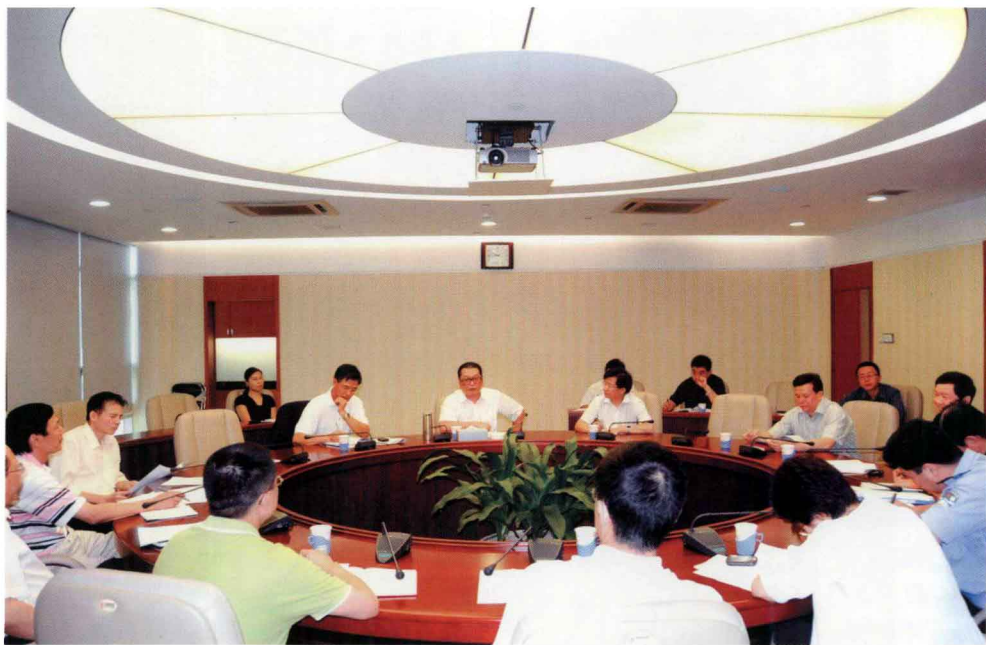
深圳市率先解决非深户籍保险营销员参加社保问题。图为2008年10月9日深圳市委常委、副市长陈应春主持召开保险创新发展领导协调小组会议，研究具体方案。