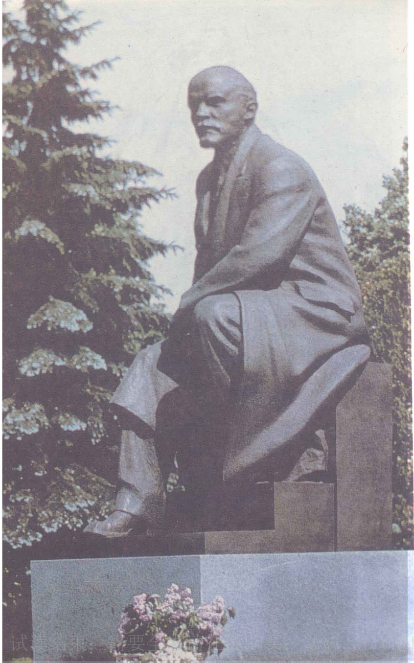
4 · 列宁纪念碑