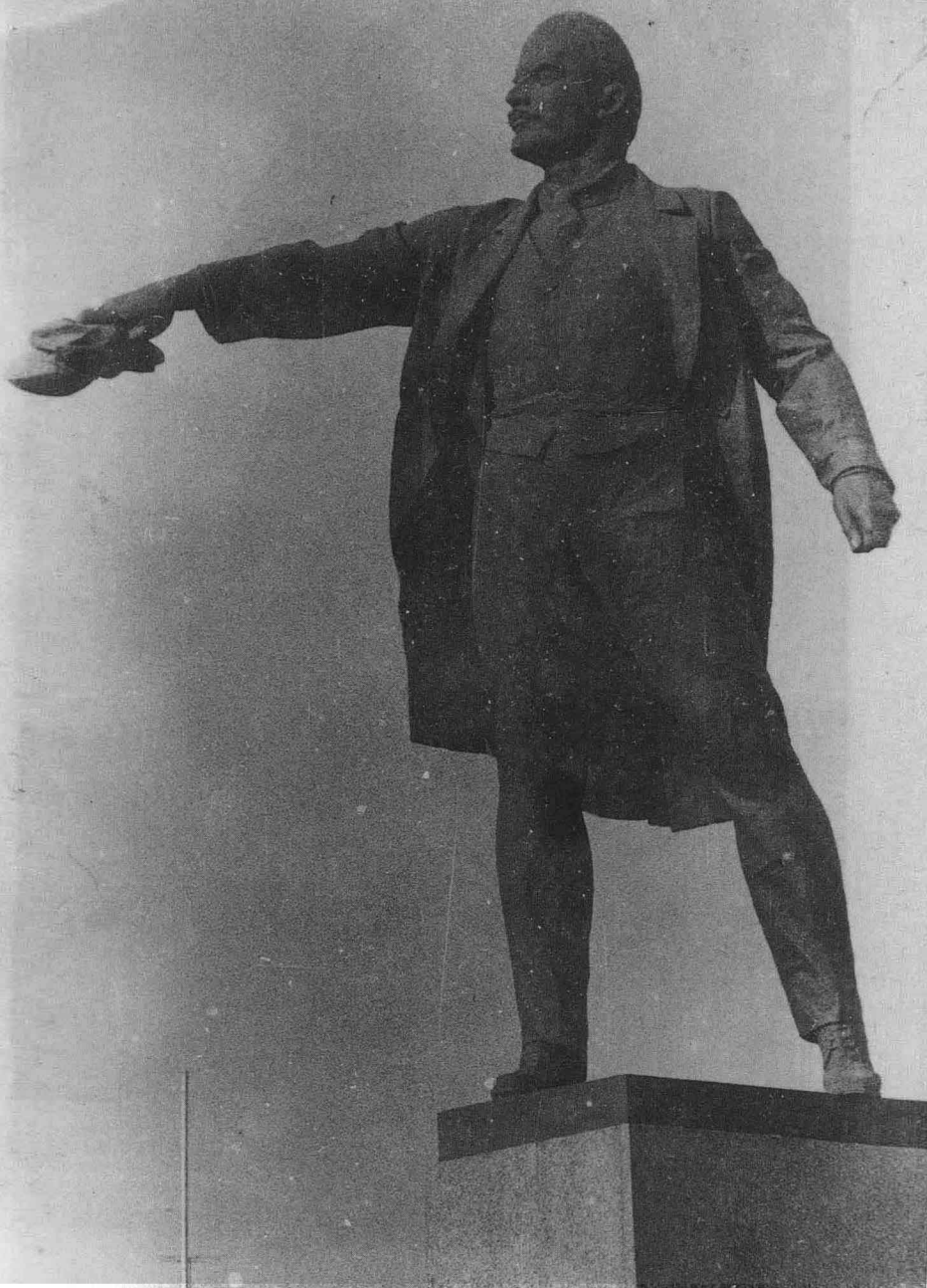
2. 列宁纪念像 同前近景