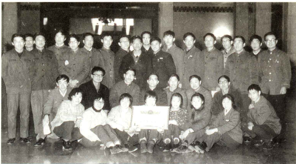
◎ 我们班被评为北京市三好班，在人民大会堂接受中央领导接见。