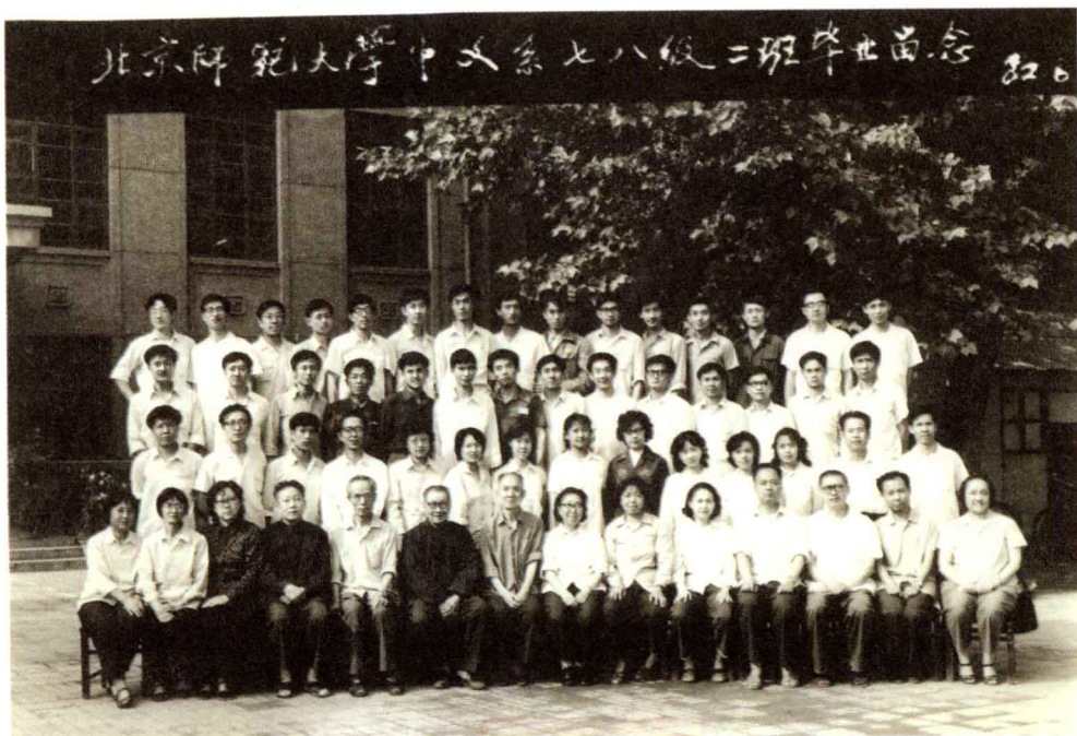
◎ 北京师范大学中文系七八级二班毕业留念