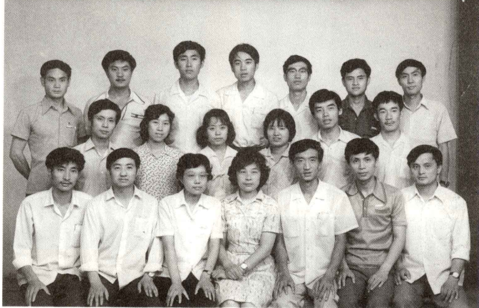
◎ 当我们年轻的时候