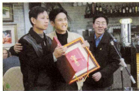
◎ 鄢烈山荣获鲁迅文学奖，同学来祝贺。