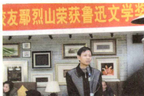
◎ 鄢烈山荣获鲁迅文学奖