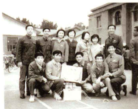
◎ 1980年, 跳绳比赛冠军