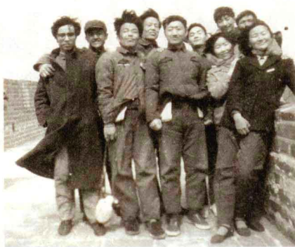
◎ 1980年春, 327室于长城