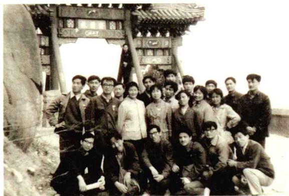
◎ 1981年春, 北京八大处