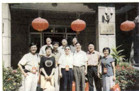
◎ 校庆百周年，图书馆前合影留念