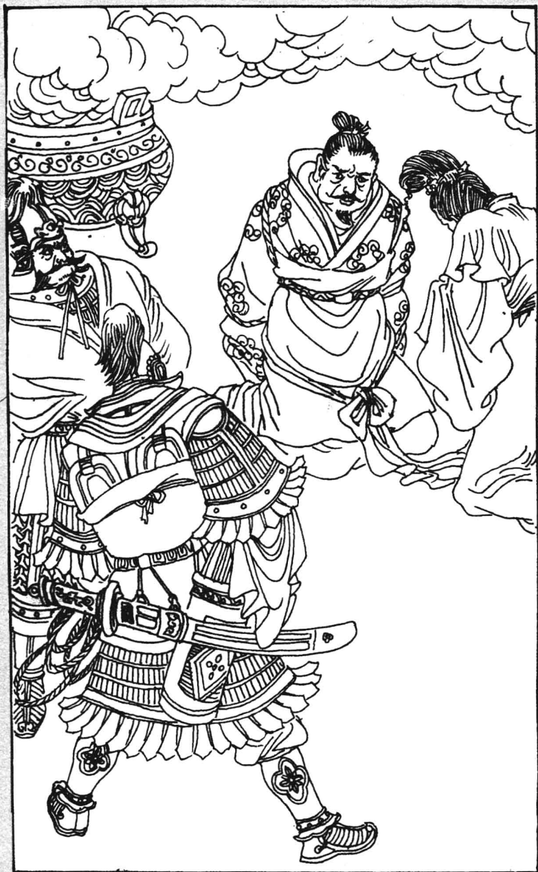
图一 帝王本无种 时势造英雄