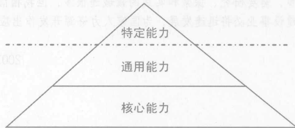
图二 能力分层体系示意图之二

不过，有一次会见一个欧洲国家驻华教育援助项目组的组长，喝茶聊天中谈到核心能力的问题，我信手就给他画了上图。没想到尽管他非常赞同和欣赏我们的研究思路和研究成果，但是，却不同意我画的这张图。他又画了下面一张图。