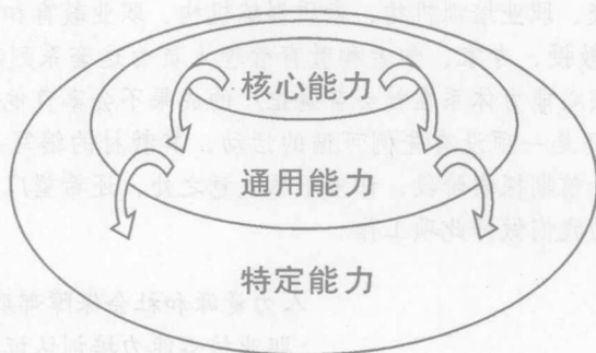
图一 能力分层体系示意图之一

我曾画过一个图来表现核心能力（见图一）。有三个同心的圈，最小的一个处在中间，它就是核心能力；围着它的第二圈是通用能力；最外面的，是特定能力。