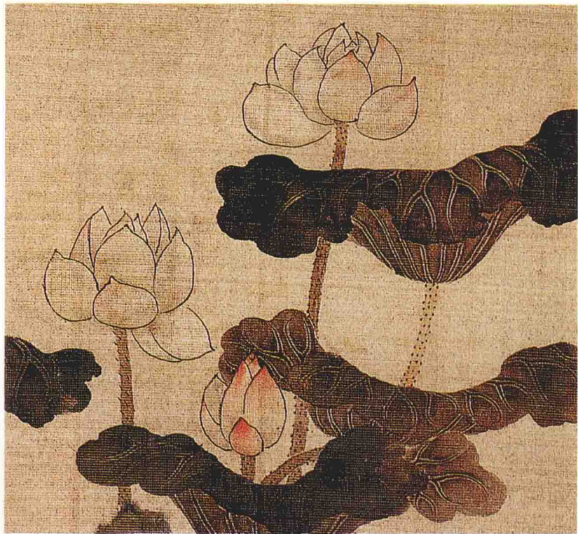
取自(明)陈洪绶《荷花湖石图》