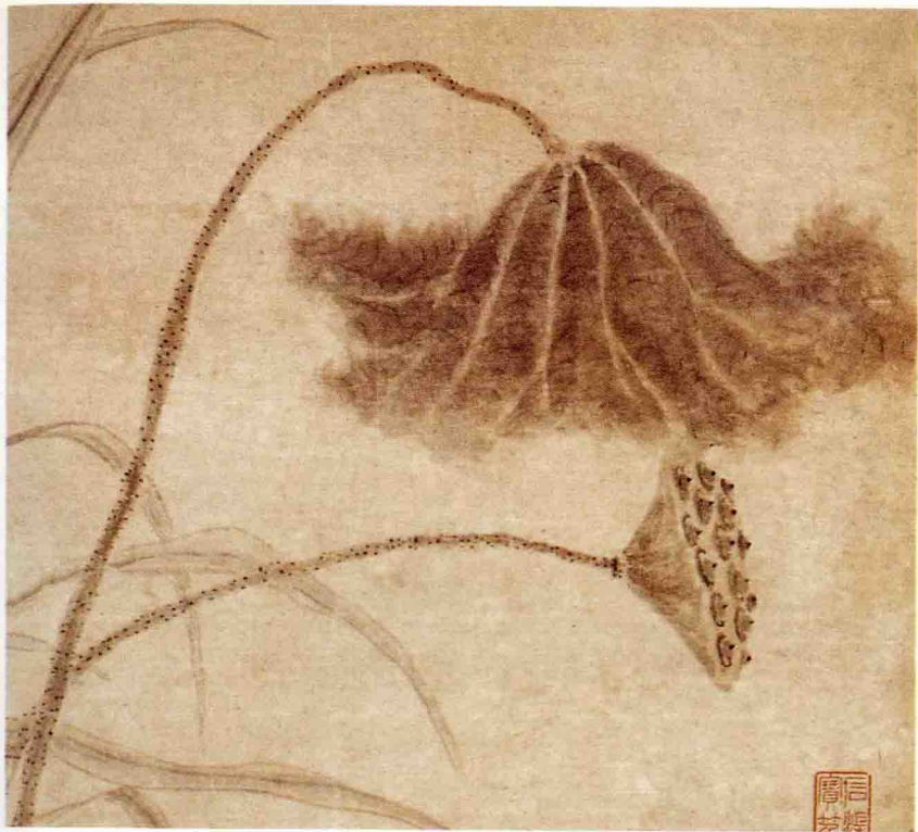
取自(元)张中《枯荷鹈鹕》