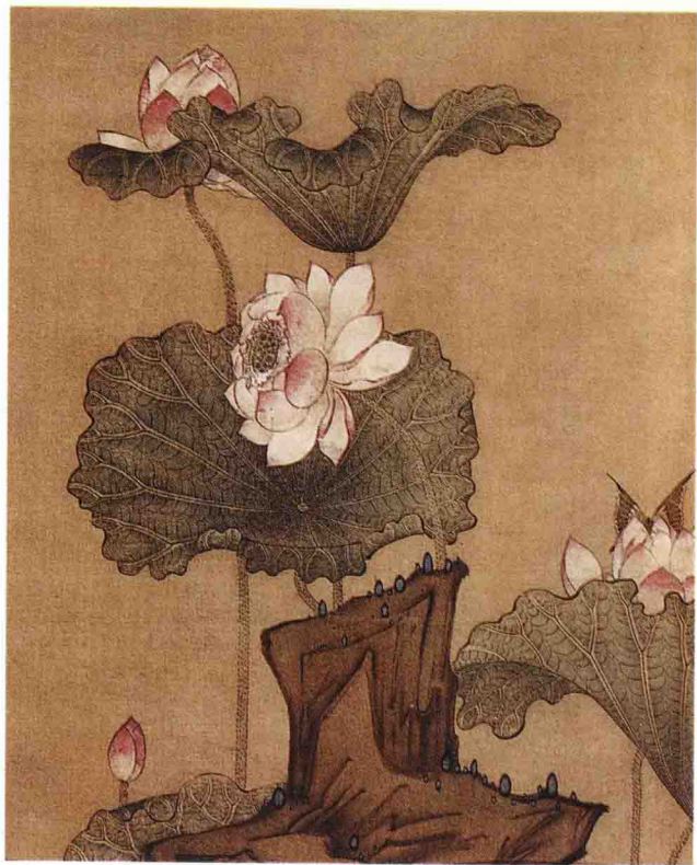
取自(明)陈洪绶《荷花鸳鸯图》