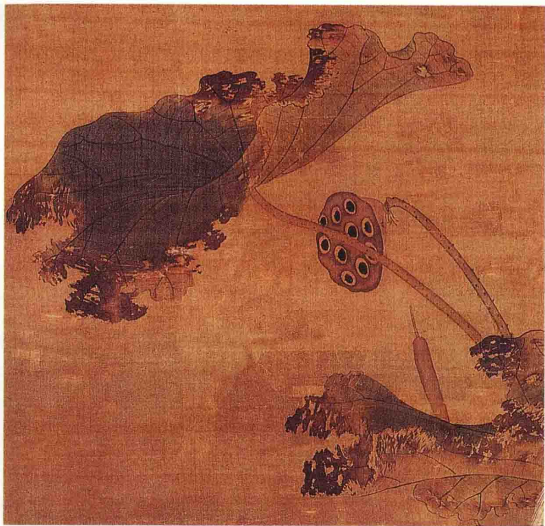
取自(明)吕纪《秋鹭芙蓉图》