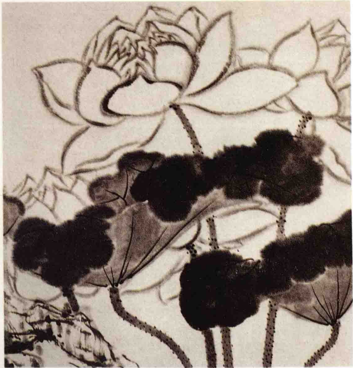
取自(明)陈洪绶《莲石图》