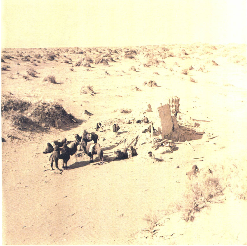
二十世紀八十年代黑水城遺址考古現場