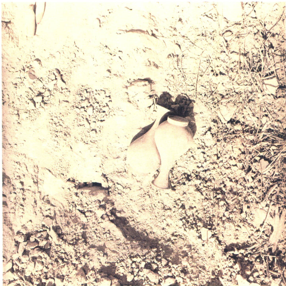
二十世紀八十年代黑水城遺址城內出土兩件銅玉壺春瓶 內蒙古自治區文物考古研究所 提供