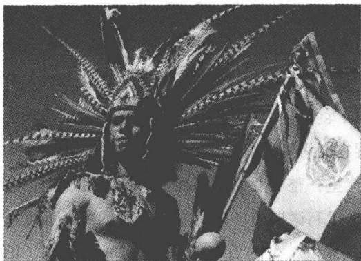
北美原土著印第安人