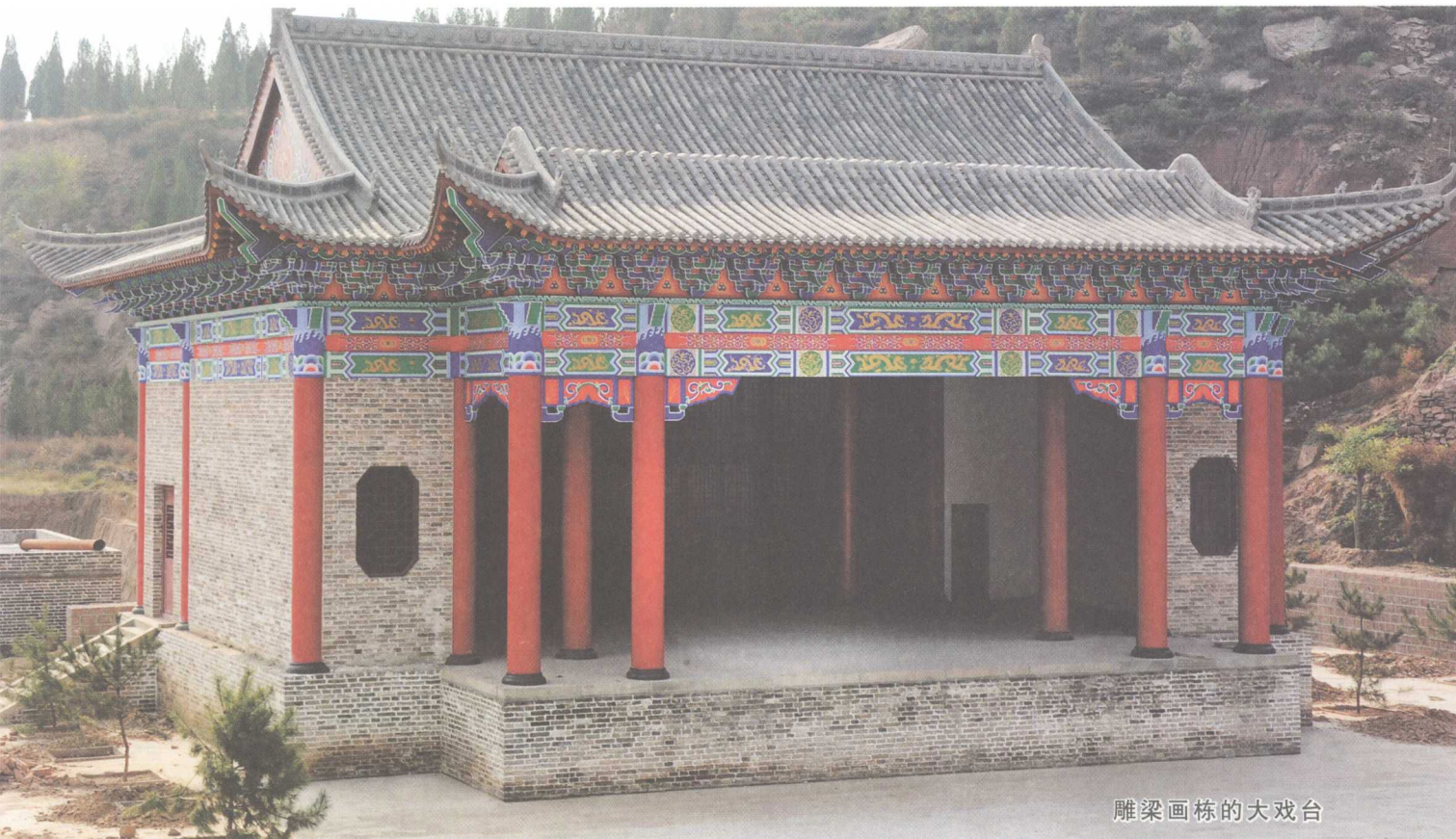
雕梁画栋的大戏台

五谷丰登。殿内，五爷高居正中，左侧为龙母、大龙王、三龙王，右侧为雨司、二龙王、四龙王。相传善男信女在五爷神座前祈祷，或保佑孩子学习进步，早日成才；或乞求风调雨顺，五谷丰登；或希望全家老少身体健康，事事如意，往往十分灵验。五台山也有座五爷庙，香火特别旺盛。五爷最喜欢热闹，因此，凡有五爷庙