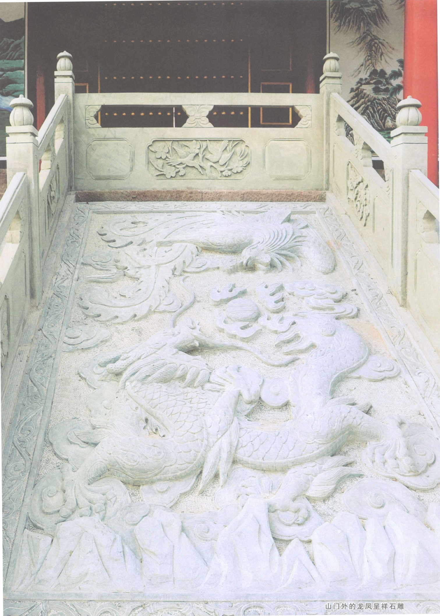
山门外的龙凤呈祥石雕