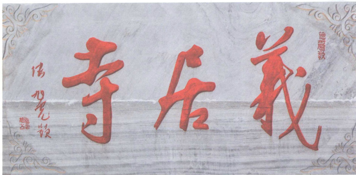
高悬于草白玉牌楼顶端的寺名匾