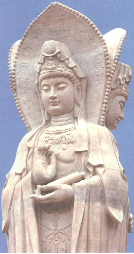
慈眉善目的持篋、持蓮、持珠观音像