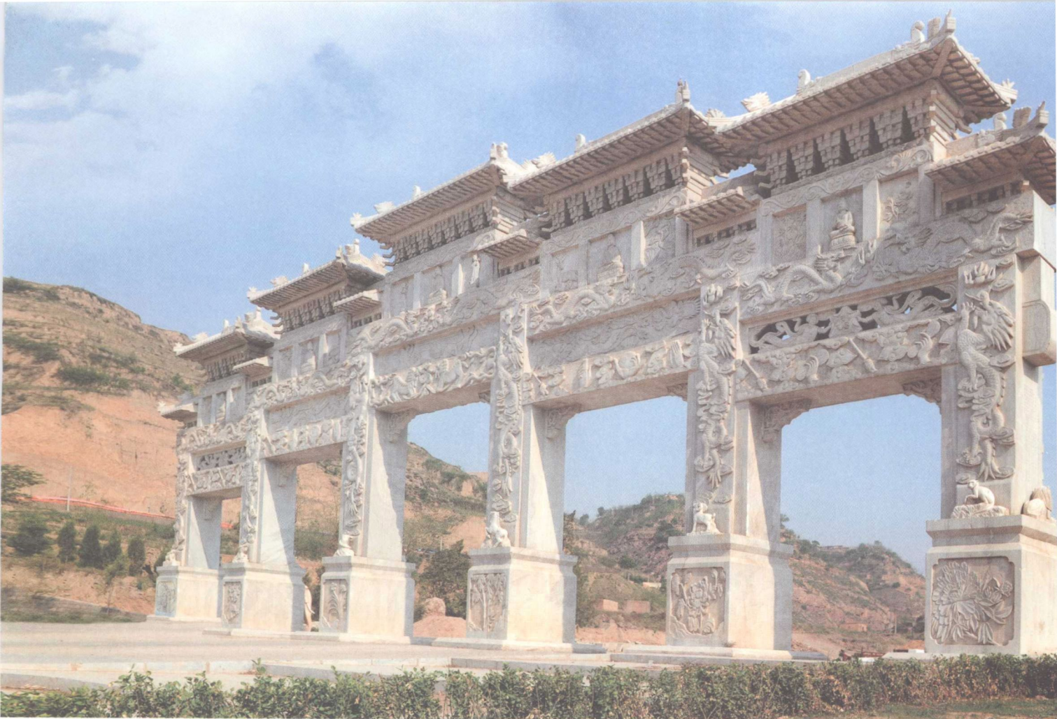
草白玉牌楼面南图