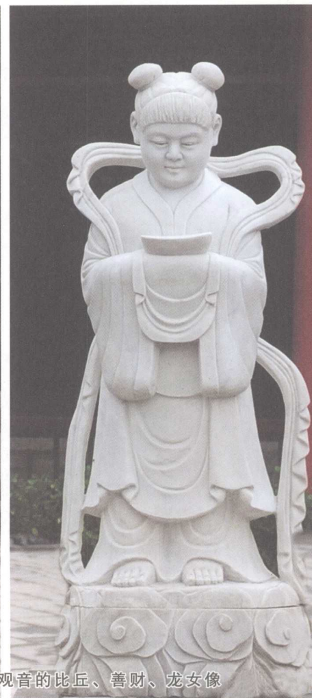
朝拜观音的比丘、善财、龙女像