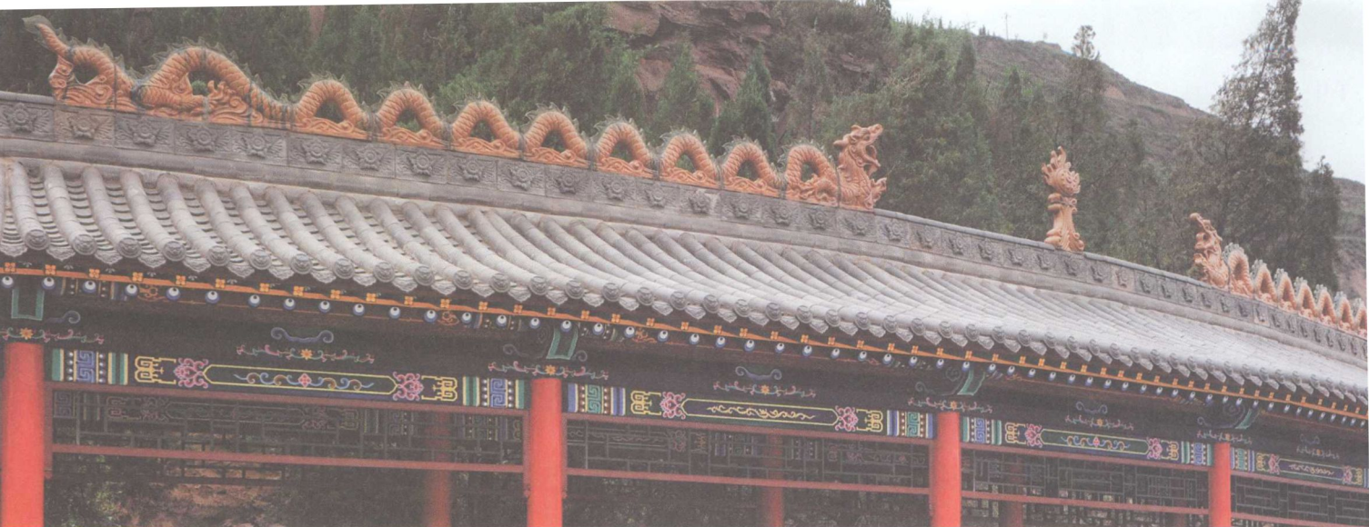
长廊顶上的二龙戏珠

一根根木质廊柱支撑，廊长逾六十丈，宽有五尺，廊内雕梁画栋，廊顶覆灰色瓦当，廊脊上共有四组二龙戏珠装饰，中间为一座龙。“甲光向日金鳞开”，九条飞舞腾跃的金龙，四颗硕大的宝珠，在晨光的照耀下鳞甲毕现，熠熠生辉。