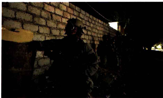
夜间巷战的突击队