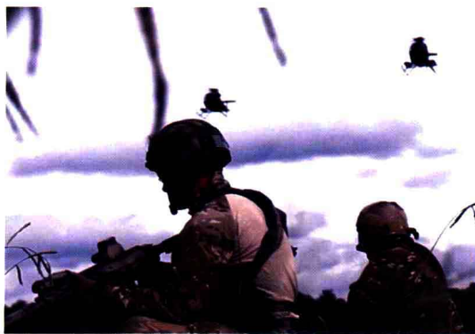
等待空中支援，准备撤退的行动小组