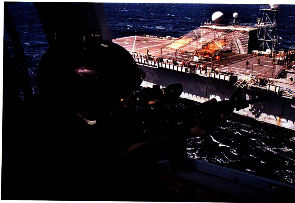
海豹突击队员训练中