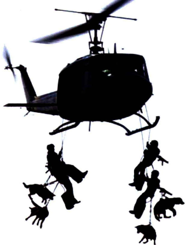
行动小组突降到 航母上