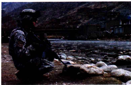
战场上的“海豹”突击队