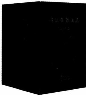
合订本，全年定价140.00元