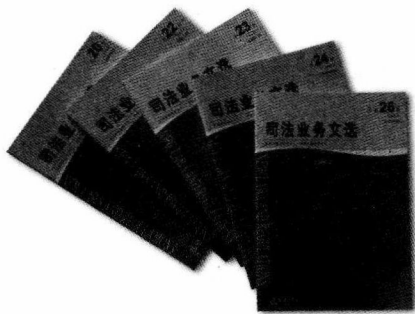
单行本，全年定价120.00元