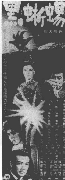
京真知子电影版黒蜥蜴， 由井上梅次导演。