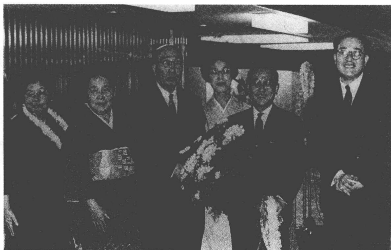
紫绶褒章获奖庆祝会，参会的有高木彬光夫妇、角田喜久雄，还有三岛由纪夫，见下幅照片。