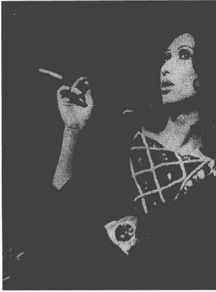
美轮明宏舞台版黒蜥蜴。