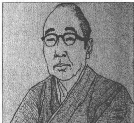
江戸川乱歩 Edogawa Ranpo (1894—1965)